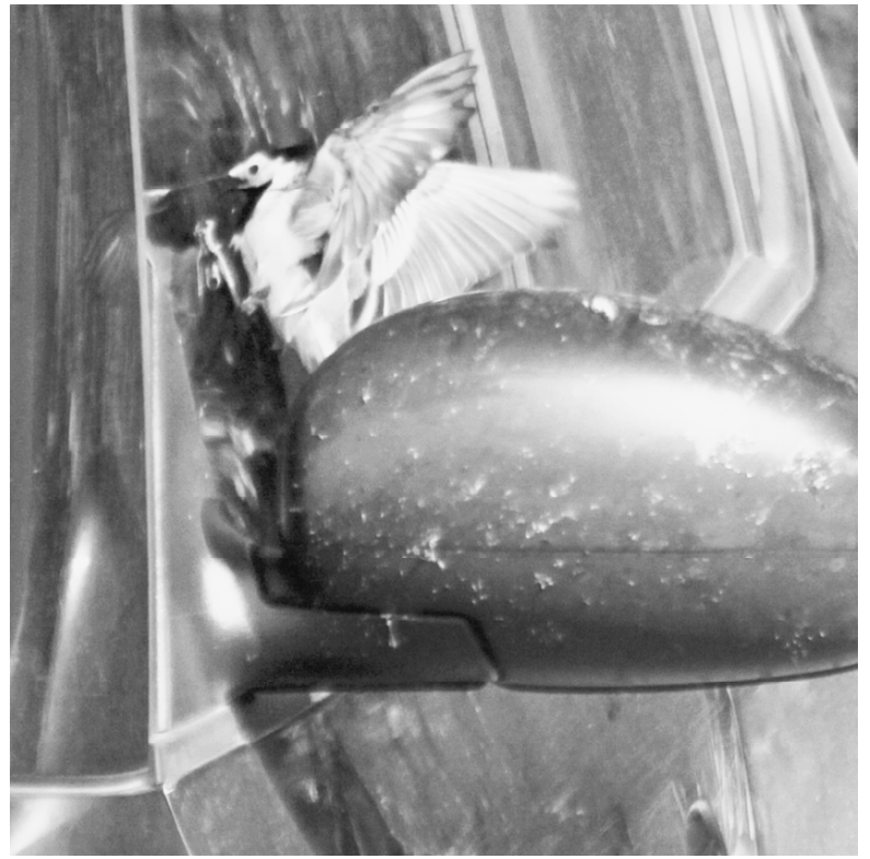
Имейте совесть! Пустите погреться...