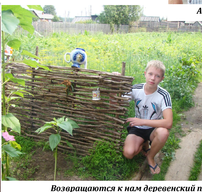
Возвращаются к нам деревенский плетень и мельница.