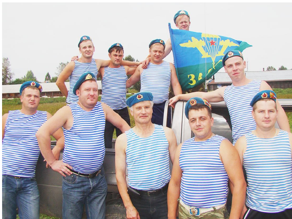
Десантное братство нерушимо.

Главный редактор-директор А.Н. СМОЛЯКОВ. Учредитель: АНО «Редакция газеты «Восход»