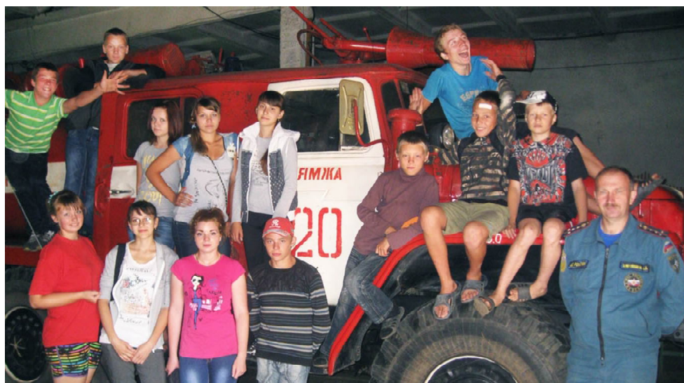
В пожарной части ребятам позволили «оседлать» машину.