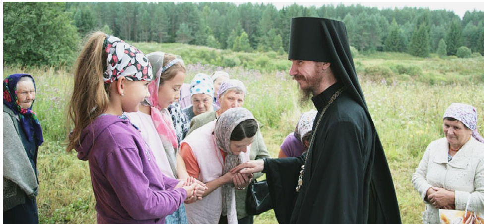
Игумен Дионисий на Сямженской земле.

В восемнадцатом веке монастырь был закрыт, здесь действовали две приходские церкви - летняя Вознесенская, которую в советское время занимал завод по переработке ягод, и зимняя Покровская, поставленная над местом упокоения святых основателей монастыря - пре-