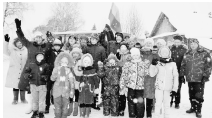
Участники "Весёлых стартов".