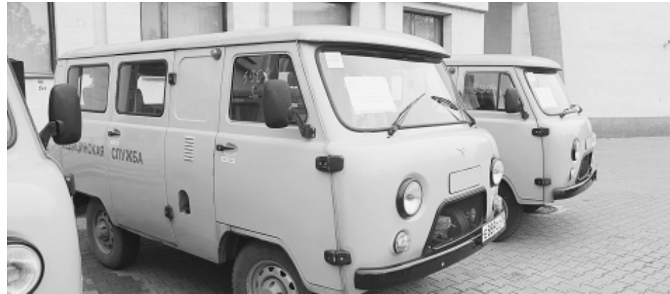
Новенький УАЗ Раменского ФАПа.