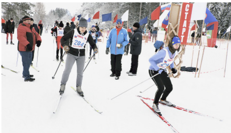
На старт! Внимание! Марш!