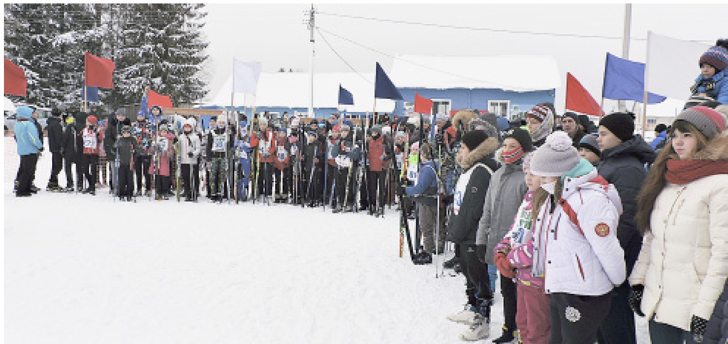
Торжественный парад открытия соревнований.