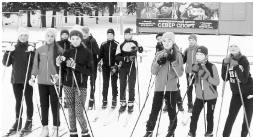
Сямженцы в "Изумруде".

- В этом году нашу спортивную школу посещает более ста учеников с первого по одиннадцатый классы Сямженской школы. Тренировки на лыжах мы начали в начале ноября. С 28 ноября по 3 декабря двенадцать ребят побывали на сборах в спортивно-оздоровительном комплексе "Изумруд". Понравилось всё: радушный приём, питание, условия проживания, со-