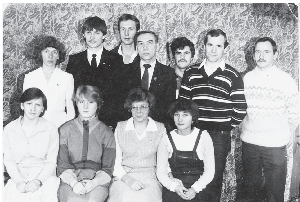
Делегация ЛПСХ на районной конференции.