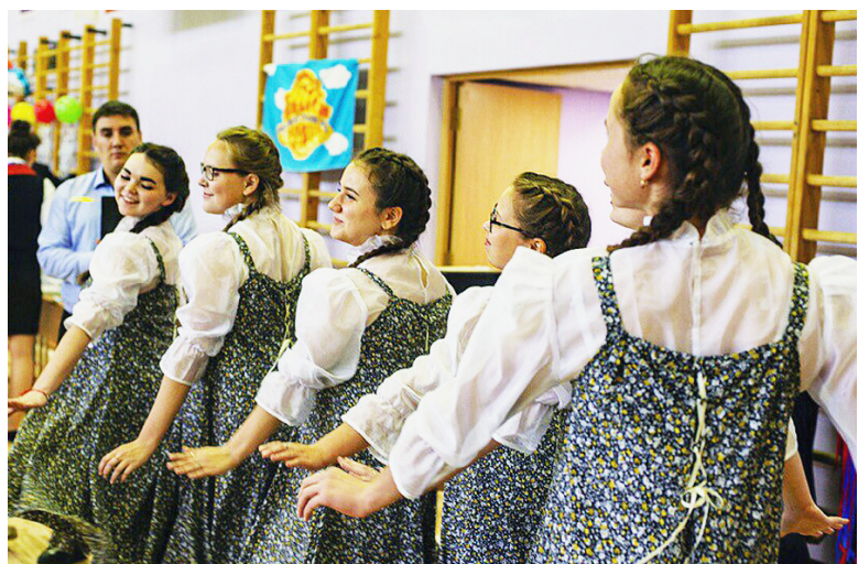
На протяжении пяти дней участники соревновались в различных конкурсных испытаниях, демонстрировали достижения школьных советов.