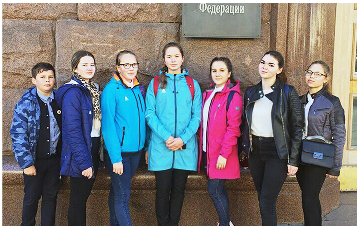
Активисты школьного ученического самоуправления Сямженской школы второй год подряд защищают честь Вологодской области на данном конкурсе.

- Финал Всероссийского конкурса УСУ - это уникальная возможность поднять уровень работы школьного ученического самоуправления, также это хороший обмен опытом и новые знакомства. Благодаря этой поездке у меня появилось много планов на улучшение работы ученического самоуправления в нашей школе. Пообщавшись со многими руководителями Союза Молодёжи в Москве, ребятами и руководителями из других школ, у меня уже появилось много новых идей,