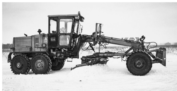
На федеральных трассах работают 268 единиц дорожной техники.

«Мы видим, что погода поменялась: температура понизилась, осадки, снег, гололед. Не только проезжая часть должна содержаться в зимний период противогололедными средствами, но и мосты должны быть готовы на региональных дорогах и в районах, — подчеркнул за-