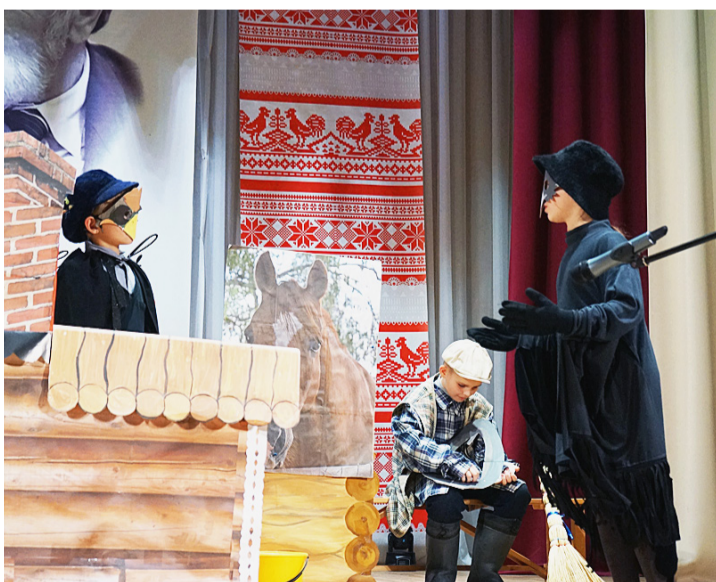
На сцене учащиеся Коробицынской школы со сценкой «Как ворона воробья обидела».