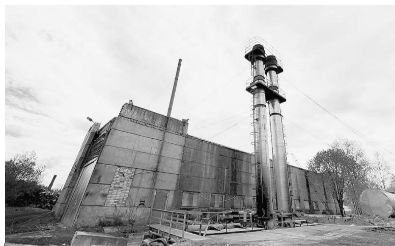
По информации отдела строительства, ЖКХ и архитектуры администрации района, в настоящее время все 15 отопительных объектов коммунального хозяйства Сямженского района полностью готовы к работе в зимний период. Нормативный запас топлива также имеется.

Особое внимание на заседании также было уделено выполнению поручения Президента РФ от 19 октября 2022 года, в соответствии с которым для регионов Северо-Запада России введен режим «базовой готовности». Органами исполнительной власти должны быть проведены мероприятия по защите населения и территорий от ЧС и техногенного характера. Повышенного внимания требуют объекты, обеспечивающие функционирование транспорта, энергетики, коммуникаций, связи и оповещения,