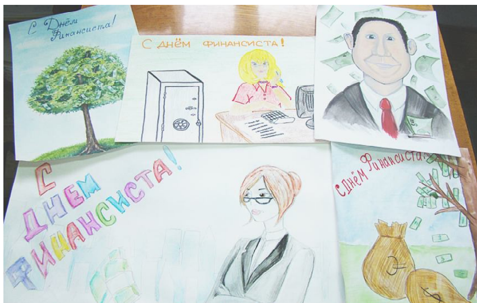
Рисунки детей к Дню финансиста.

Противоэпидемический отдел БУЗ ВО "Центр по профилактике инфекционных заболеваний".