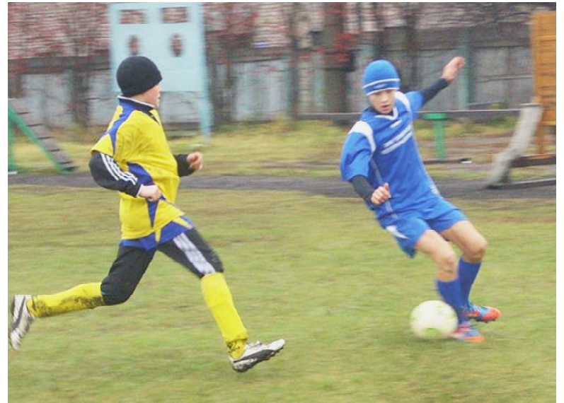
На футбольном поле.