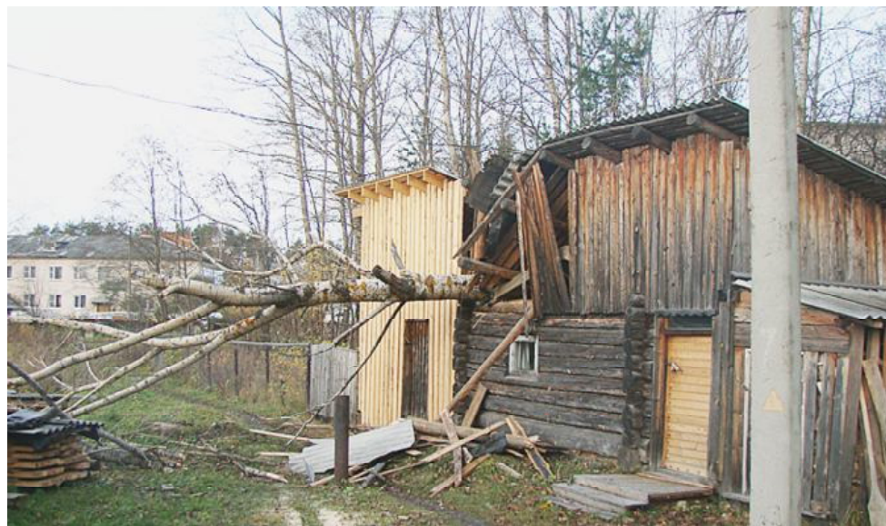
Упавший тополь повредил баню, но здесь ходят и люди.

Почему тополя не были спилены сразу же? Ситуацию комментирует Ю.М. Степунин: "Территория, где растут эти деревья, раньше принадлежала районной больнице. Но мы переоформили землю, провели межевание, и с марта 2012 года она