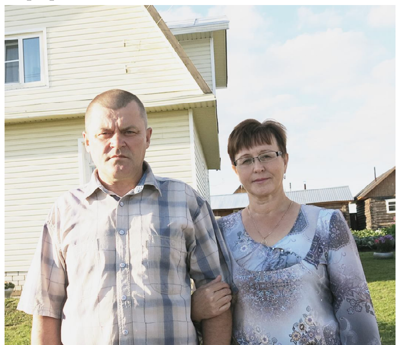
Хозяева уютного дома.

В День села Сямжи и Бельтяевской ярмарки были подведены итоги районных смотров-конкурсов. В конкурсе на самый благоустроенный жилой дом победи-