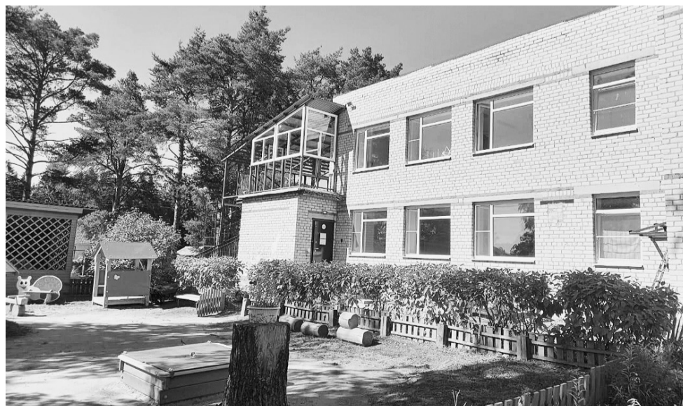
В этом году благодаря решениям, принятым на Градостроительном совете, был проведен ремонт Детского сада №1. Утеплена и отремонтирована кровля, обустроены эвакуационные выходы и отмостка, сделан ремонт крылец.

Много было сделано и благодаря проекту «Народный бюджет». В деревнях и поселках появились новые спортивные площадки, колодцы, памятные знаки, построен мост через реку Режу в Колтырихе. Отмечу проделанную работу в райцентре: разобраны и расселены аварийные дома на улицах Советская и Садовая, проведены ремонт пешеходной дорожки и благоустройство территории у лавы на улице Пролетарской. Очень надеюсь, что бетонные мостки не будут затоплять во время весеннего половодья, и жители свободно смогут перейти с одного берега на другой. Важным моментом стало то, что была приведена в порядок территория около здания отдела полиции на улице Румянцева и у жилых домов на улице Парковой. Огорчает, что мы не смогли полностью заменить асфальтовое покрытие на улице Советской. Все прекрасно знают эту проблему, которая уже не первый год остается одной из самых актуальных в Сямже. Уже начата работа с подрядчиком по ее устранению, продолжится она и в году наступающем.