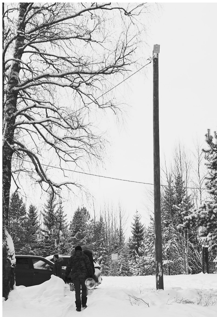
Рядом с ключиком 28 декабря сотрудниками РЭСа был установлен фонарь для уличного освещения. Работать он будет в обычном зимнем режиме: с 15:30 до 8:30.