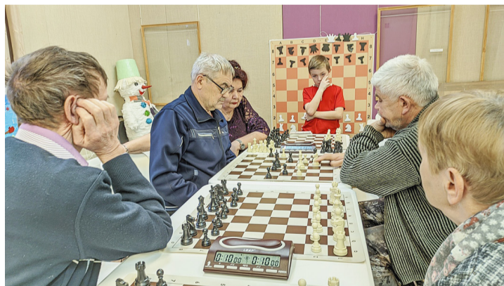
Двери клуба открыты для всех желающих играть в шахматы.

«Смелая пешка» — так называется шахматный клуб для людей с инвалидностью, который функционирует с июня этого года в Сямже на базе МАУ СМР «Спортивная школа» при поддержке Правительства Вологодской области.