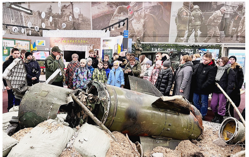
Выставка вооружений и военной техники, захваченной российской армией во время специальной военной операции на Украине.