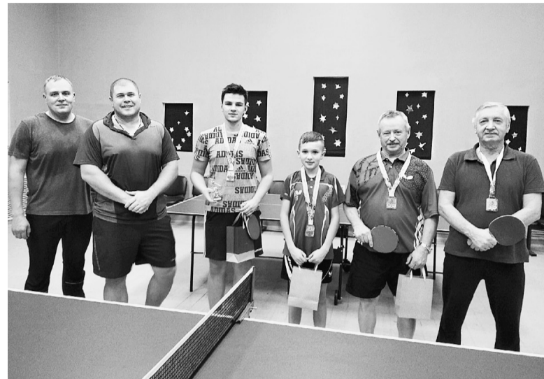
Финалисты турнира по настольному теннису.

В минувшие выходные в Сямже состоялся традиционный осенний Чемпионат района по настольному теннису. Любители этого вида спорта всегда с интересом и азартом подходят к любым турнирам, проводимым в районе. Эти соревнования не стали исключением.