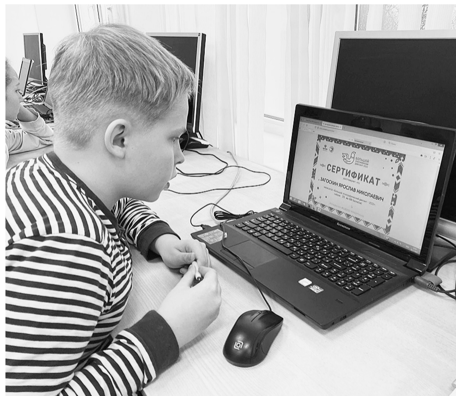
Сямженцы — активные участники акции.