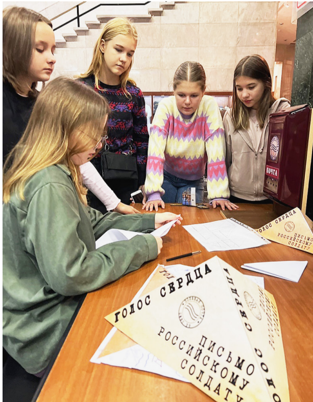
Сямженцы написали письма поддержки бойцам, участвующим в специальной военной операции на Украине.