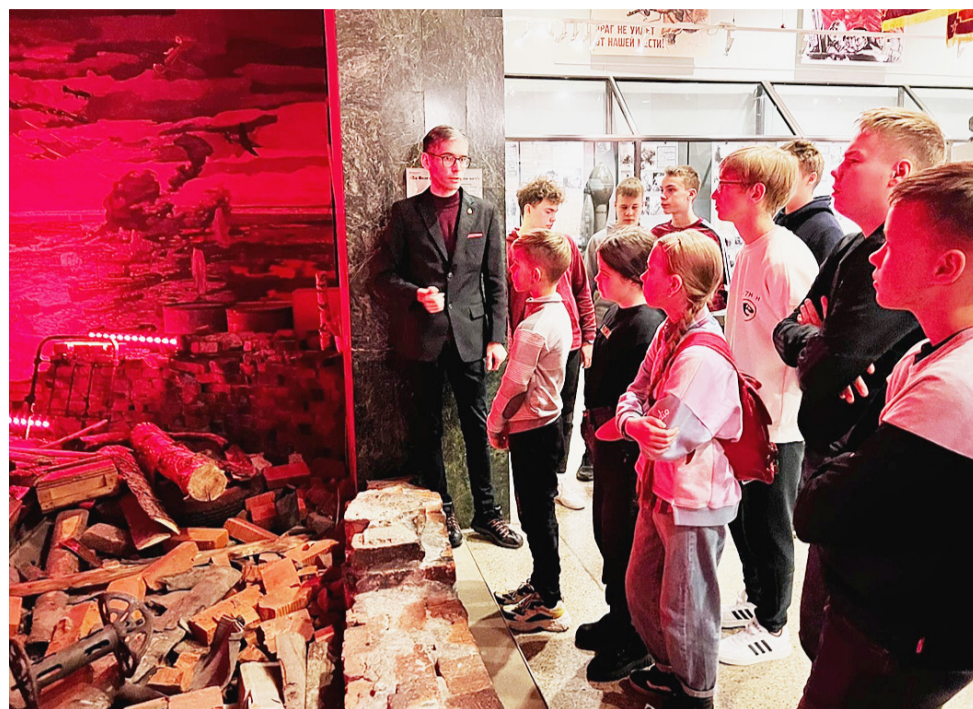
В Центральном музее Вооруженных Сил РФ.

В этот день патриотическую поездку немного разнообразили. Мы посетили Московский зоопарк, который является одним из старейших (1864 г.) в стране. По размеру коллекции он занимает четвертое место среди европейских зоопарков и входит в первую десятку зоопарков мира, обладающих самыми обширными коллекциями животных. Школьники с интересом наблюдали за здешними постояльцами: фламинго, леопардом, слонами, пандой, обезьянками, морскими котиками... и внимательно слушали экскурсоводов. К слову сказать, время пролетело незаметно, и нас в этот день ждало еще одно не менее увлекательное приключение — поездка по Москве-реке на речном трамвайчике. Виды столицы открылись с другой стороны. Появилась возможность созерцать завораживающие пейзажи и центральные достопримечательности за бортом, в комфортабельных условиях без пробок. Смеркалось. Теперь мы наблюдали исторические здания и центр города в яркой подсветке. Красота неопишная, захватывающая дух.