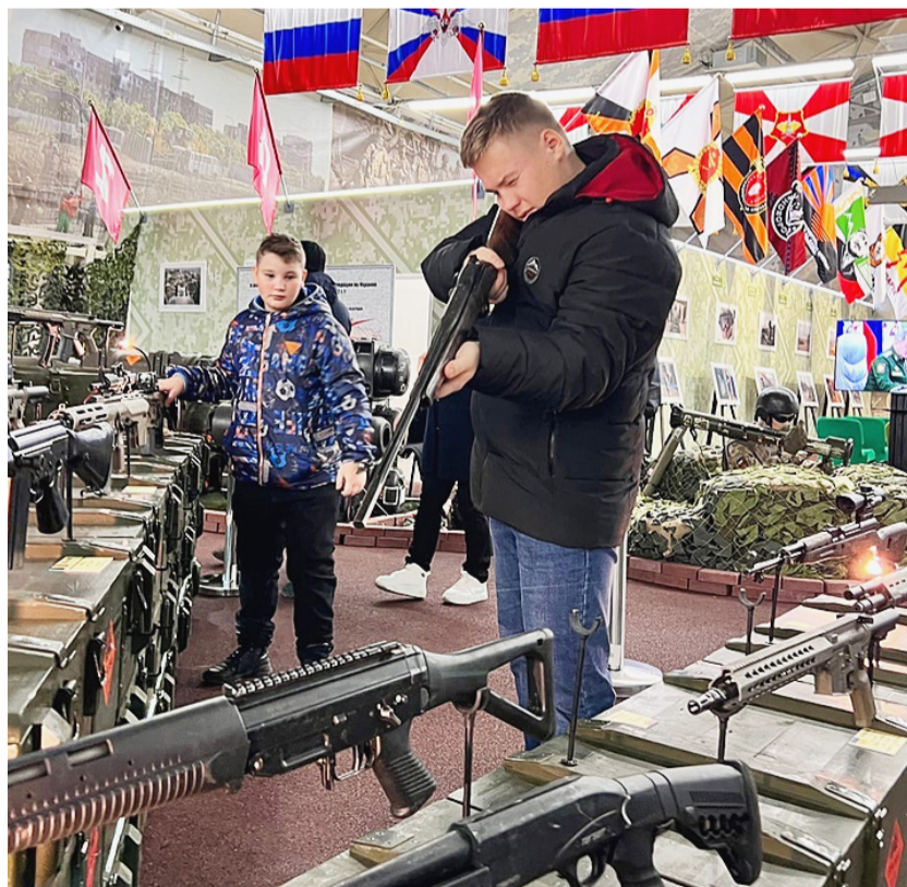
Мальчишкам особенно понравилось разглядывать военную технику и оружие.

Екатерина ТИХОМИРОВА.