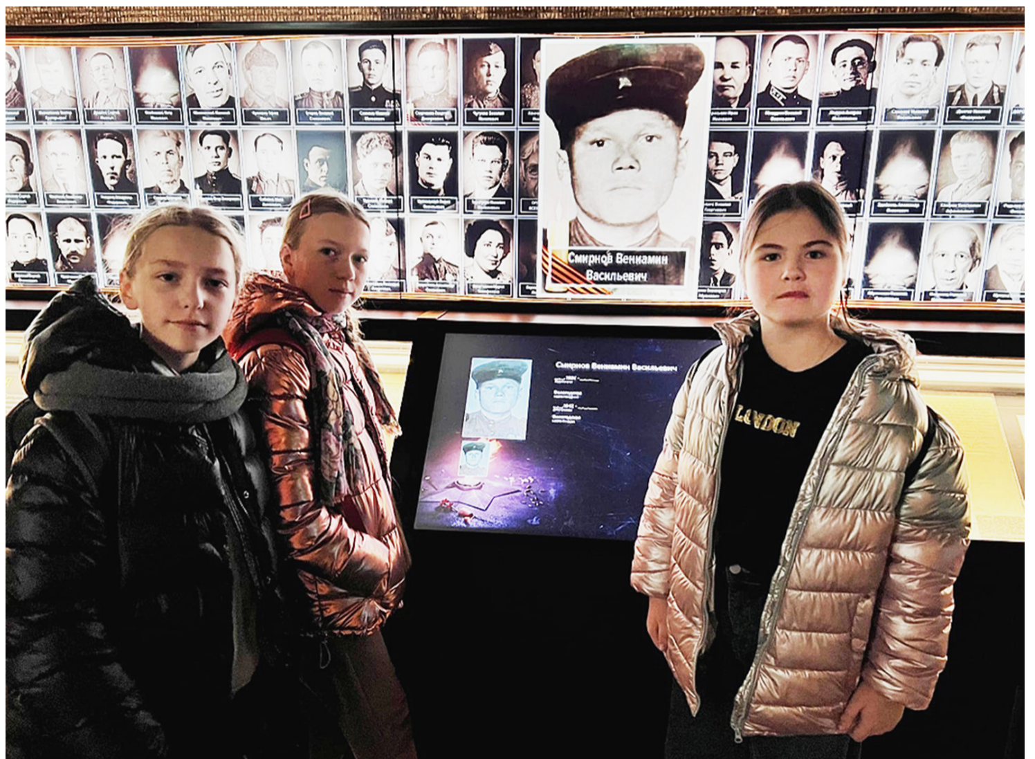
В музейном комплексе «Дорога памяти» сямженцы нашли фото своих родственников-участников войны.

Утром на вокзале нашу большую делегацию встретили представители Национального центра управления обороной. Неподалеку уже ожидали два комфортабельных автобуса с полицейским сопровождением. Проверив, все ли на месте, мы отправились в военно-патриотический парк культуры и отдыха Вооруженных Сил