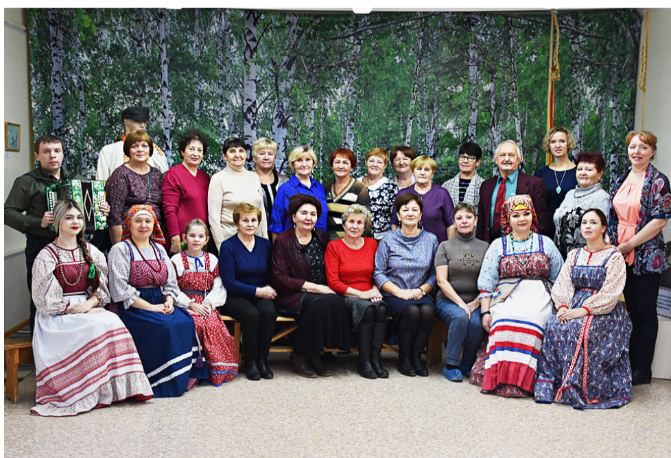
В этот день посетителей в музее было довольно много, и у каждого в запасе была своя частушка.