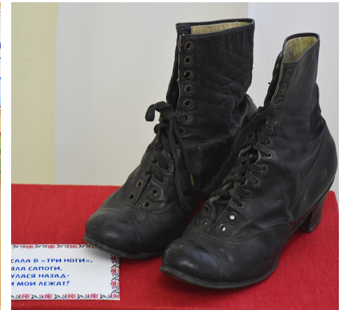
По всему залу расставлены предметы и образы, которые чаще всего упоминаются в наиболее известных четверостишиях.