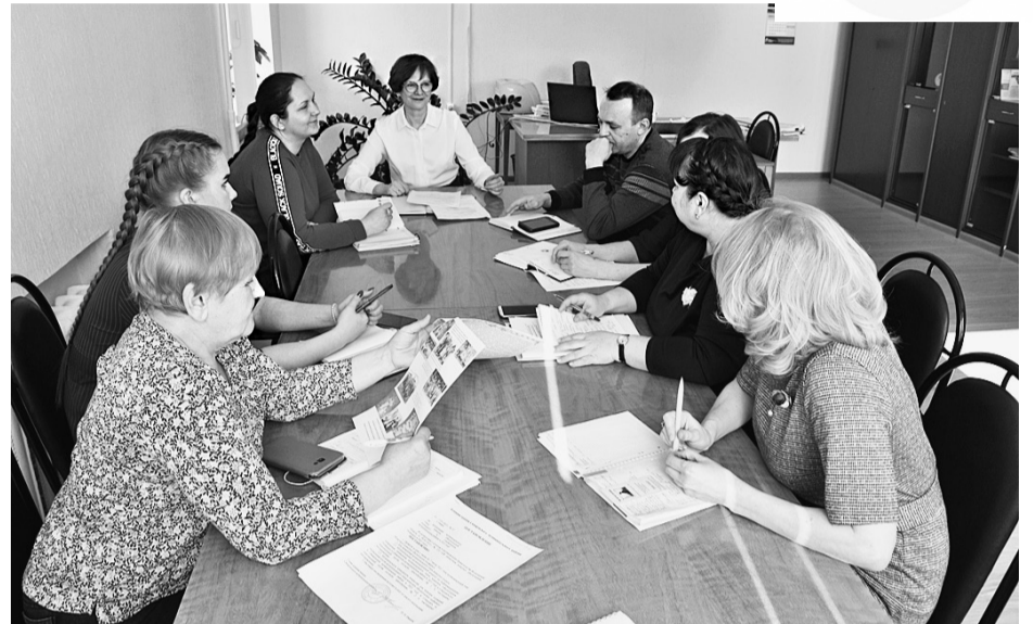
Заседание организационного комитета.

Он включает в себя два направления – «Молодежное подворье» и «Ветеранское подворье». В каждом из них есть целый ряд номинаций. Например: «Самое благоустроенное подворье», «Лучшие животноводы», «Лучшие пчеловоды» и многие другие. В первом участие принимают молодые семьи, ведущие ЛПХ, причем возраст каждого из супругов должен быть не старше 35 лет, а в направлении «Ветеранское подворье» – граждане пожилого возраста, ведущие ЛПХ, и возраст супругов должен быть не менее 57 лет для женщин и 62 лет – для мужчин. Конкурс состоит из двух этапов – му-