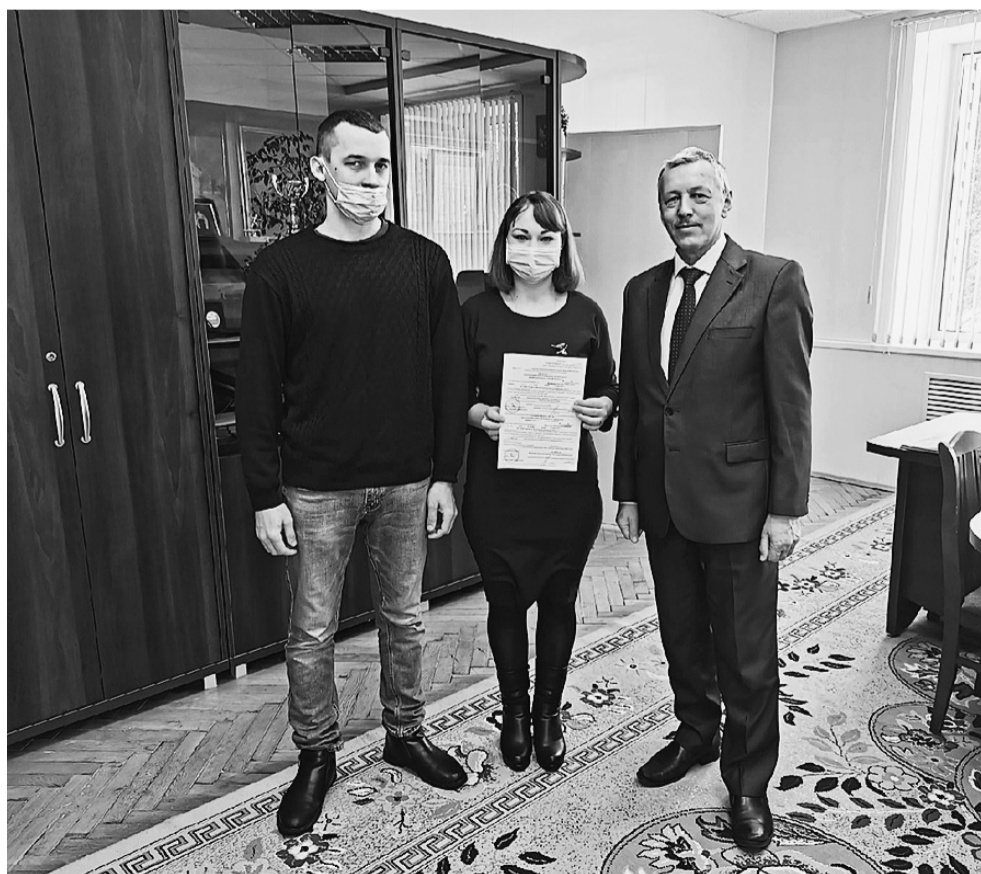
Вручая свидетельства, Глава Сямженского района Александр Фролов поздравил будущих новоселов с радостным событием.

В минувший понедельник, двадцать второго марта, в здании администрации Сямженского района состоялось вручение свидетельств о предоставлении выплаты на строительство жилья в сельской местности в рамках подпрограммы «Обеспечение доступным и комфортным жильем сельского населения» государственной программы «Комплексное развитие сельских территорий Вологодской области».