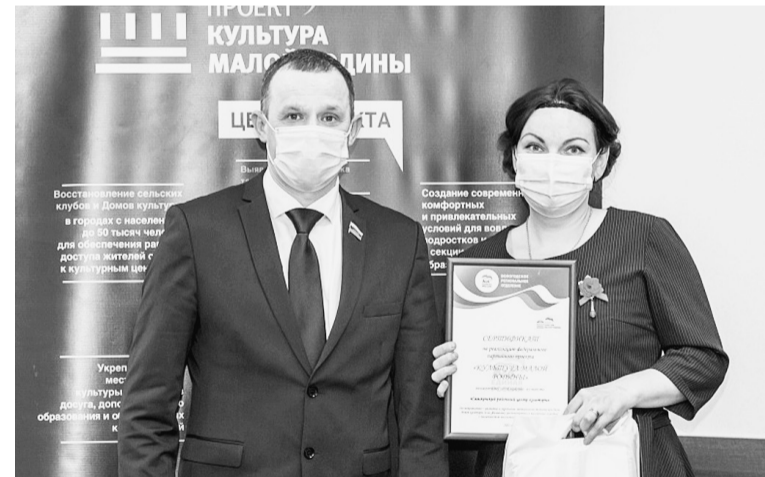
Районный Центр Культуры принял участие в проекте «Культура малой Родины» и стал обладателем сертификата номиналом 600 тысяч рублей.

Районный Центр Культуры в очередной раз принял участие в проекте «Культура малой Родины» партии «Единая Россия» и получил финансовую поддержку на укрепление материально-технической базы. Сертификат номиналом 600 тысяч рублей используют на покупку активной акустической системы.