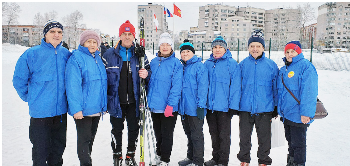
«Бронзовая» команда сямженских ветеранов на областной зимней Спартакиаде.

Сямженцы приняли участие в V областной зимней Спартакиаде ветеранов и пенсионеров в рамках фестиваля «Спортивное долголетие». Трехдневные соревнования прошли в г. Вологда с 17 по 19 марта и собрали на своих стартах более ста активистов из двенадцати районов области.