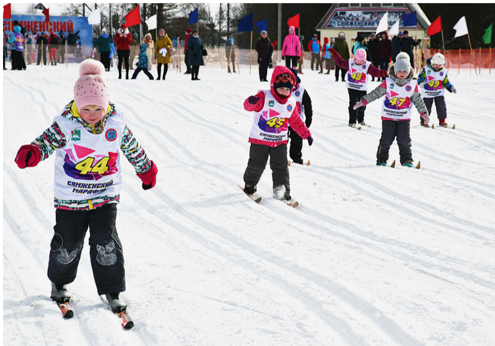
На лыжне самые юные спортсмены.

Казалось бы, совсем недавно мы писали об открытии лыжного сезона в Сямженском районе, а в минувшие выходные состоялось его официальное закрытие – на старты шестнадцатого «Кубка промышленников и предпринимателей» вышло более ста спортсменов из нескольких районов Вологодской области.