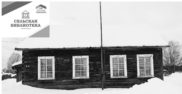
Здание библиотеки в поселке Ширега Раменского поселения ни разу не видело ремонта.

В этом году по программе губернатора «Сельская библиотека» здесь будет сделан капитальный ремонт. На выделенные деньги около миллиона рублей произведут ремонт кровли, полов, стен и фасада здания. Также в рамках работ запланированы устройство крыльца, отмостки и подвесных потолков, замена