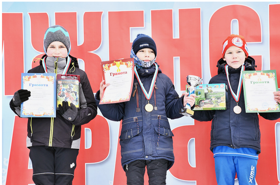
Подрастающее поколение сямженских чемпионов.

Дмитрий СМИРНОВ.