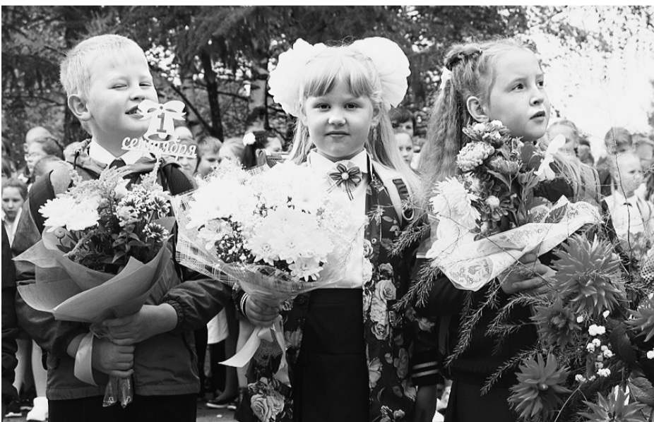
После завершения приема заявлений 30 июня в течение трех рабочих дней издается приказ о зачислении детей в школу.

По информации Управления образования Сямженского района подготовила Елена СЕКУШИНА.