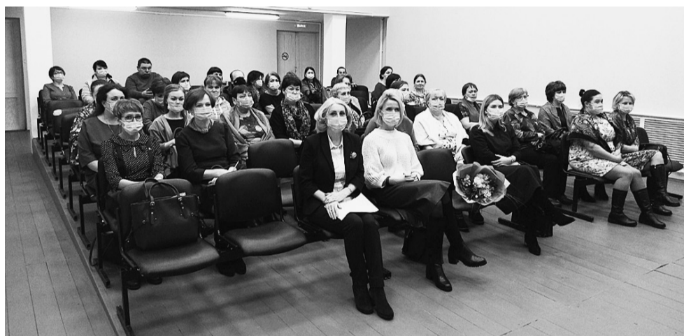
Работники учреждений культуры Сямженского района.