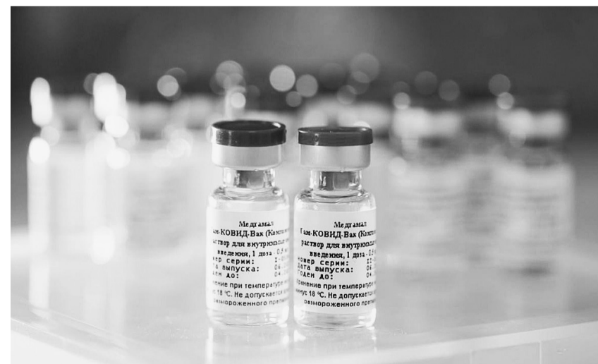
Глава региона Олег Кувшинников поручил еженедельно докладывать о ходе поставок вакцины и масштабах иммунизации населения.

Ситуацию с обеспечением Вологодчины препаратом для иммунизации обсудили на оперативном совещании при губернаторе.