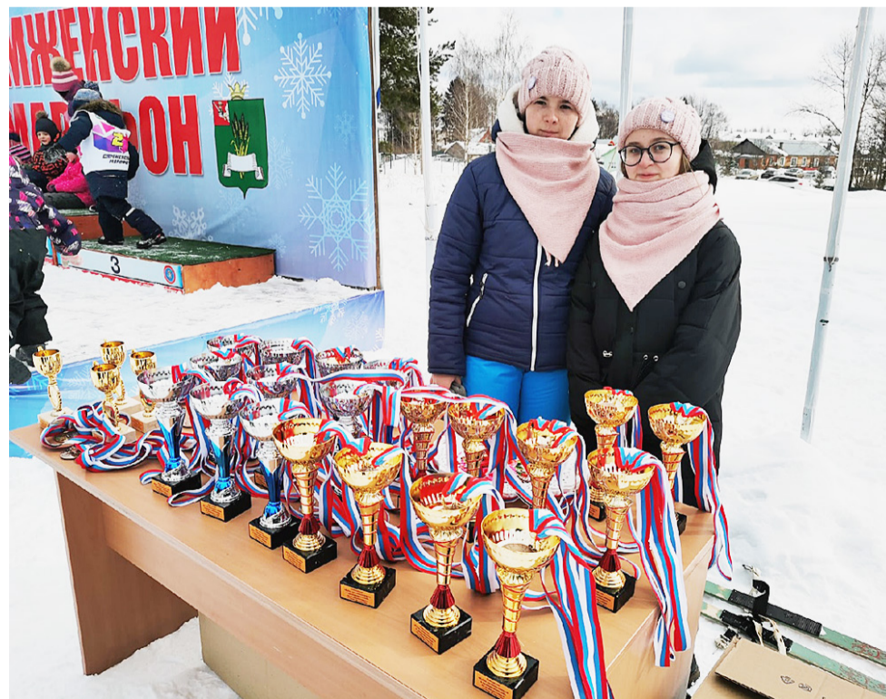
Волонтеры принимали участие в церемонии награждения.