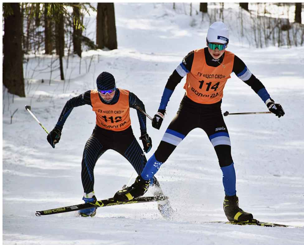
Борьба на финишном подъеме.

Вслед за малышами на старт отправились и остальные возрастные группы. В отличие от Марафона, который состоялся совсем недавно, длинные дистанции в этот день отсутствовали,