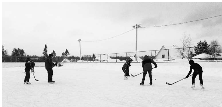
Ребята с удовольствием и желанием посещают все мероприятия, проводимые на спортивных объектах.