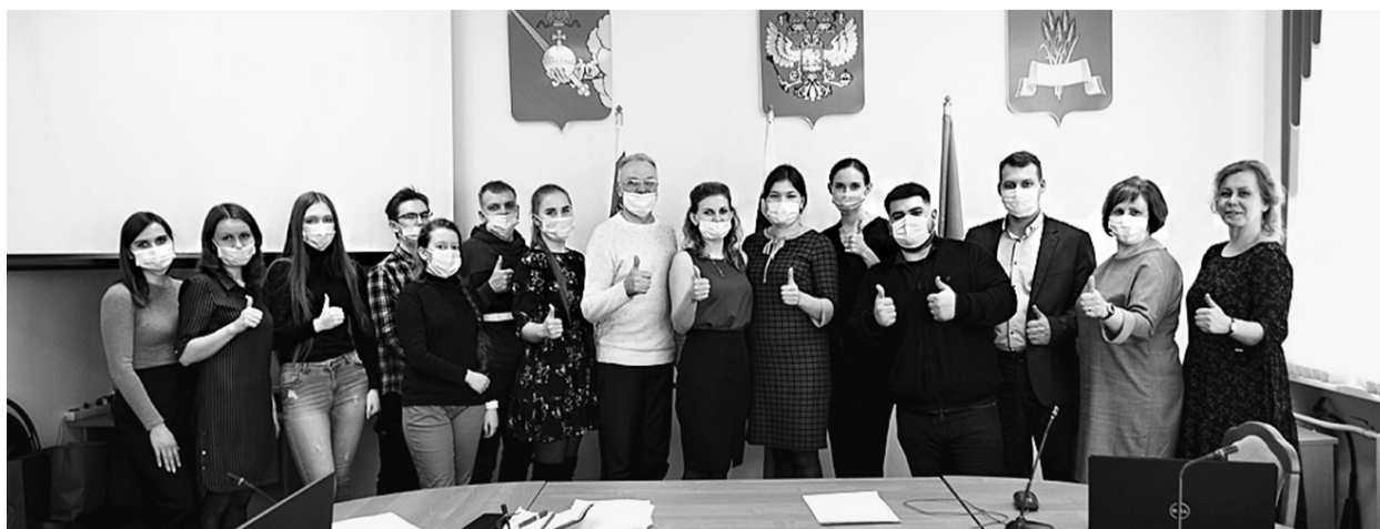
На память о встрече была сделана коллективная фотография.