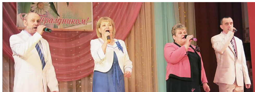
Выступает народный вокальный ансамбль «Надежда».