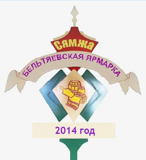
СХЕМА ДВИЖЕНИЯ ТРАНСПОРТА И ПРАЗДНИЧНЫЕ МЕРОПРИЯТИЯ В РАМКАХ ДНЯ СЯМЖИ И БЕЛЪТЯЕВСКОЙ ЯРМАРКИ -