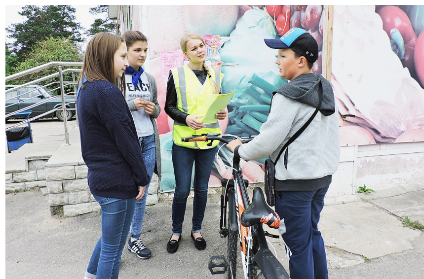
ОГИБДД по Сямженскому району.

Организаторы мероприятия провели беседы с велосипедистами, в ходе которых проверили у них знание Правил дорожного движения, разъяснили, что велосипед является "транспортным средством", соответственно, лицо, управляющее им, относится к категории участников дорожного движения, как водитель. А водители пересекать проезжую часть дороги могут только, спешившись со своего "двухколесного друга". Также внимание акцентировалось на правила маневрирования (жесты велосипедистов), на необходимость использования защитной экипировки и световозвращающих элементов в темное время суток. Кроме того, волонтеры вручили каждому водителю двухколесных транспортных средств памятки с основами ПДД.