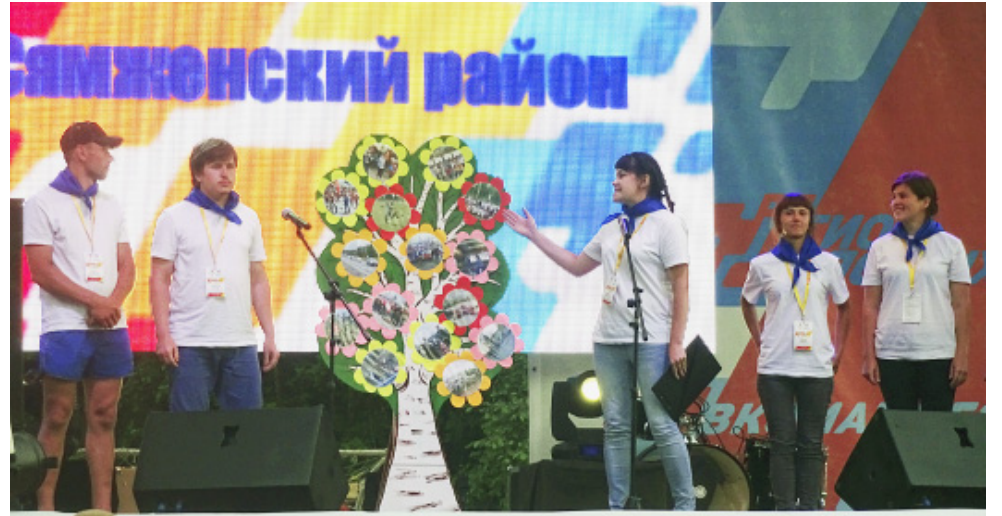
Конкурс деятельности молодежных активистов.

Члены общественной организации "Исток" показали посетителям ярмарки, как выглядел воин. Участники слета смогли примерить шлем и кольчугу, принять участие в поединке на спортивных мечах. Представительницы проекта "Ресторанный день" пригласили всех опробовать