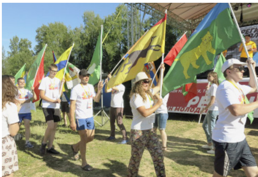
Церемония открытия слёта «Регион молодых»