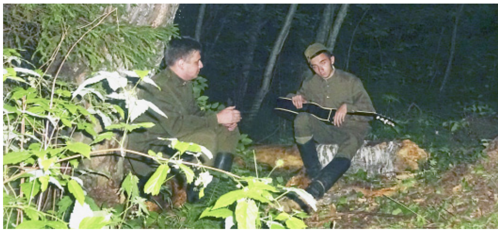
«Тишина» - вечернее мероприятие.