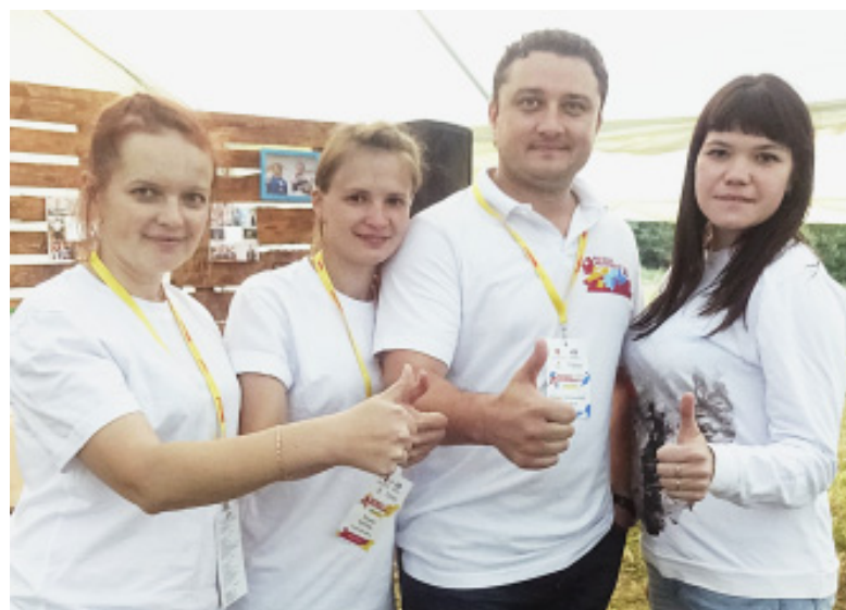
«Путь депутата» от Дениса Долженко.