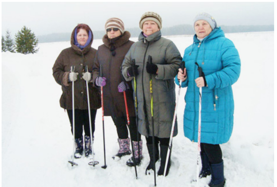
Гремячинские женщины на прогулке.