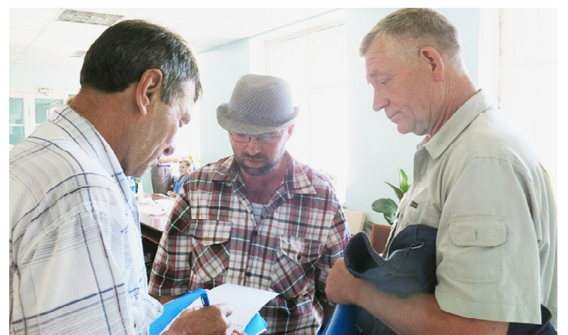
После заседания - обмен мнениями.