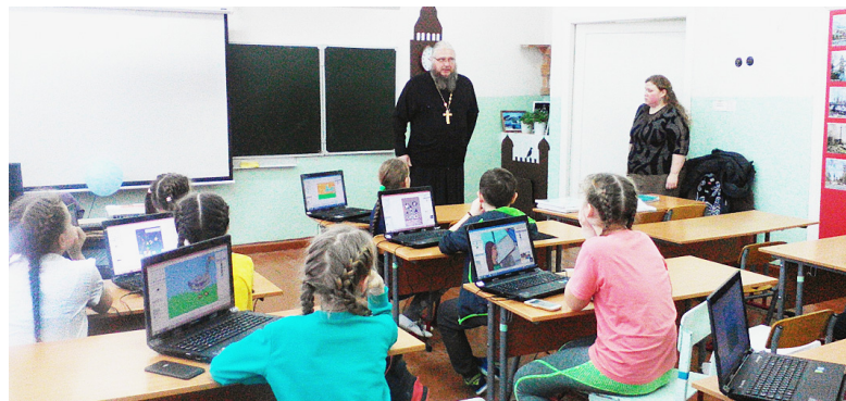
На уроке компьютерной графики.