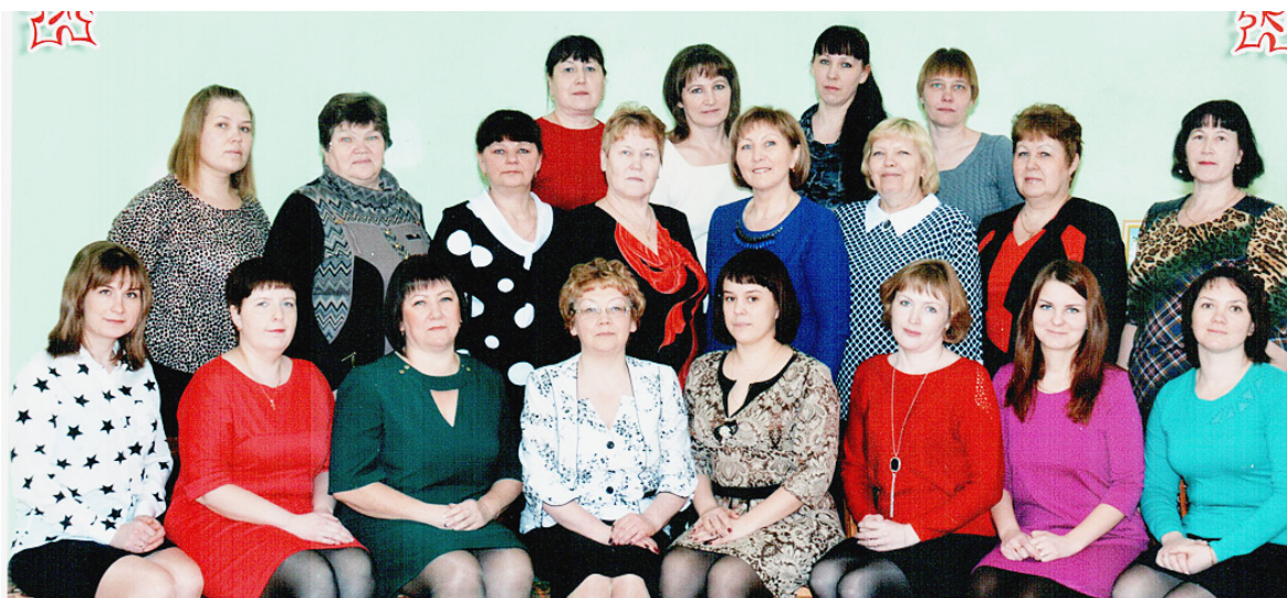
Коллектив детского сада - это коллектив единомышленников.