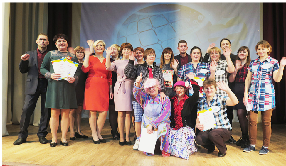
Районный КВН будет жить!