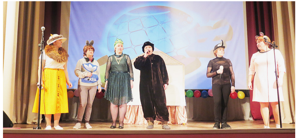
Сказка «Теремок» на современный лад в исполнении команды «Кнопочка».

В первом конкурсе «Весь мир — театр, а люди в нем — актеры» участники должны были представить свою команду в музыкально-сценической форме. В конкурсе-разминке «Как вам