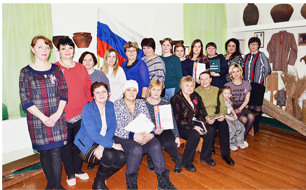
Совместное фото на память.

К печати подготовила Екатерина ТИХОМИРОВА.