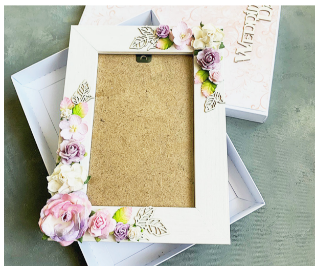
Каждая вещь мастерицы — настоящий шедевр.