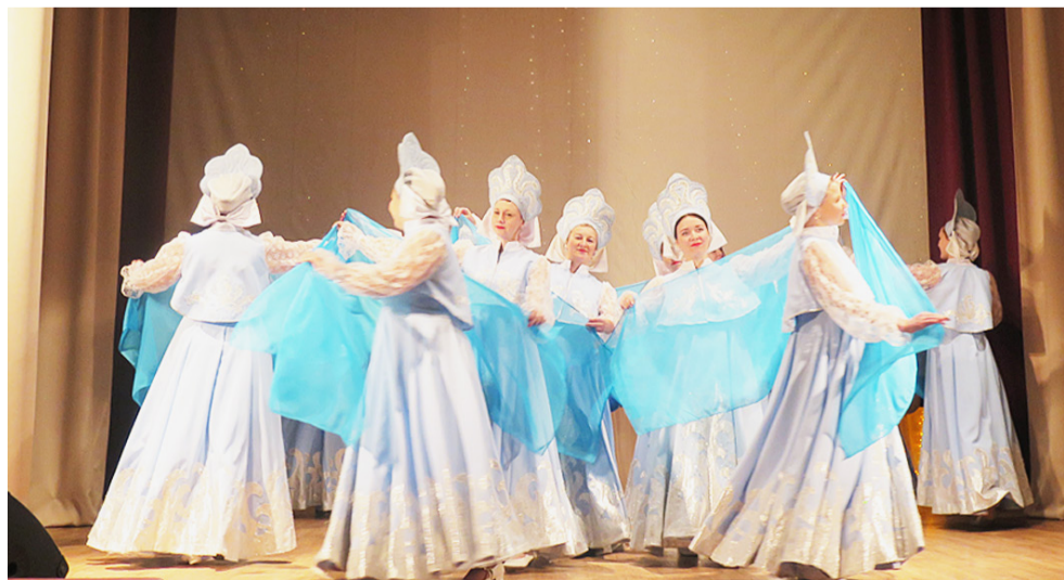
Коллектив «Любава» (г. Харовск) с танцем «Гляжу в озера синие».