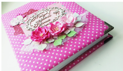
Фотоальбом для новорожденного.