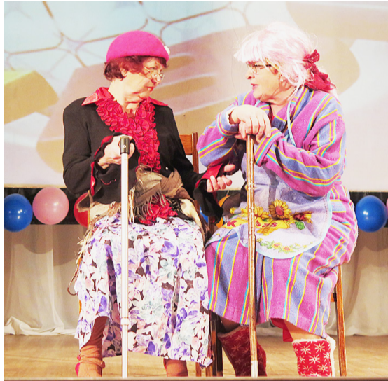
Устьрецкие «Девчушки-веселушки» показывают «Домашнее задание».

В прошлую пятницу в Сямже было «нашествие» смеха и юмора: в Районном Центре Культуры состоялся «Театральный КВН», посвященный году театра и двадцатилетнему юбилею Сямженской команды КВН «Тинейджеры». На сцене в этот день встретились «Кнопочки» (Гремячинский ЦК), «Девчушки-веселушки» (Устьрецкий ДК) и «КМТС» (Двиницкий ДК). В составе жюри были бессменный автор шуток Александр Суворов, представители местной команды КВН «Тинейджеры» и работники РЦК.