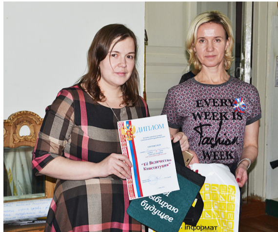
Команда «Молодежного парламента» стала победителем мероприятия.

— под таким названием в преддверии государственного праздника в краеведческом музее прошло тематическое мероприятие.