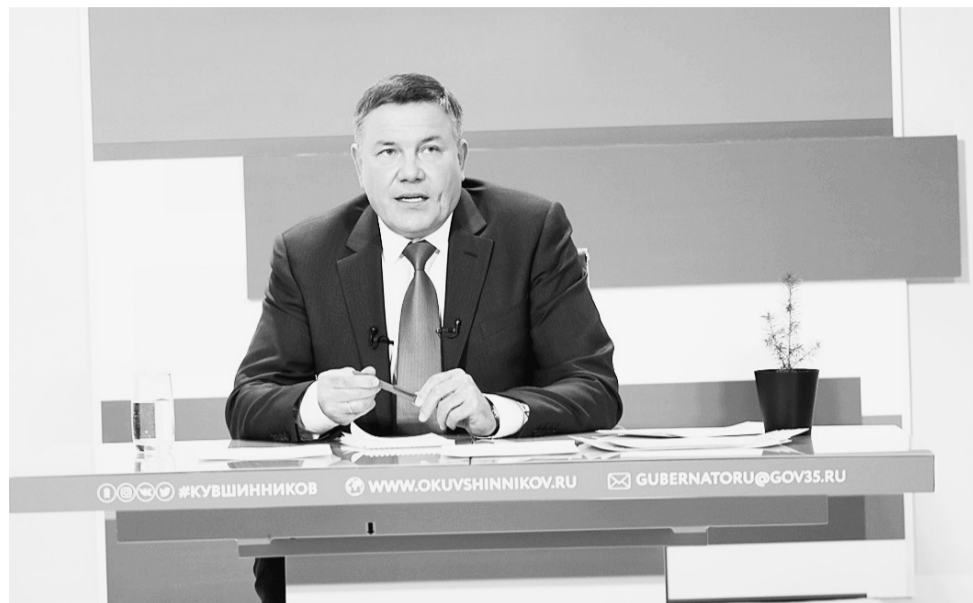
Олег Кувшинников заявил, что ответит на все вопросы вологжан, которые поступили в рамках «Прямой линии».

Активнее других проявили себя жители Череповца, Вологодского, Череповецкого, Сокольского, Грязовецкого, Великоустюгского и Вытегорского районов. Рекордсменами по количеству обращений стали жители города Вологды. Они прислали около