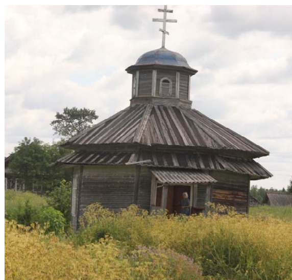
Часовня Тихвинской иконы Божией Матери.