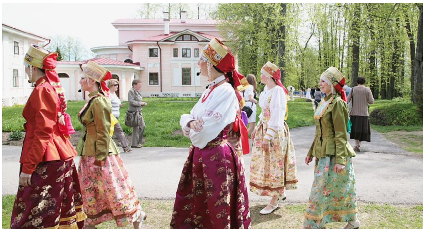
Концерт под открытым небом в усадьбе Покровское.