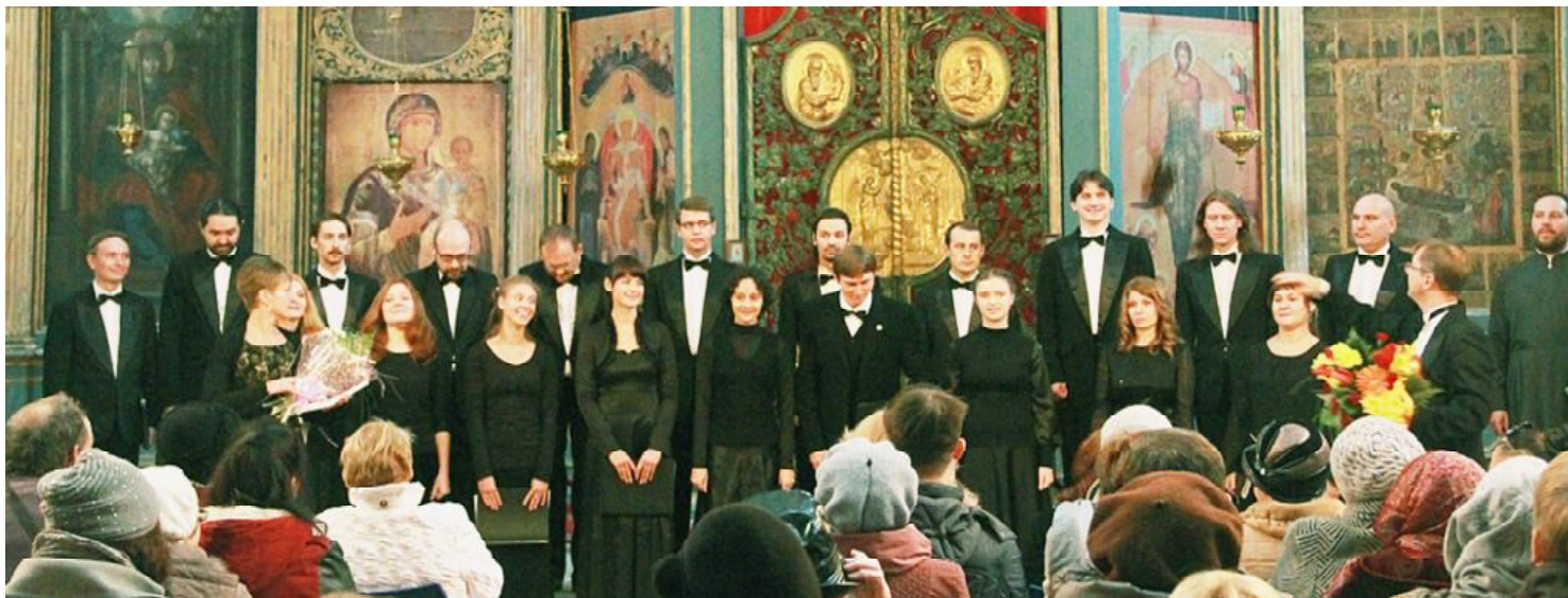
Вологодский фестиваль классической музыки «Кружева». Духовные песнопения в Софийском соборе.

Но среди губернаторов не так много заядлых театралов, любителей симфонической музыки и классического искусства. Мы, конечно, знаем позитивные примеры. Но это не должно быть делом вкуса! Если мы говорим о государственной политике, она должна быть системной, комплексной, равной. Разве можно сравнить возможности, конституционно гарантированные, равного доступа к культурным ценностям жителей Москвы, Санкт-Петербурга, Владикавказа или поселка Чикурдах в Саха-Якутии? Очевидное неравенство. Сложная, большая страна. Очень сложно устроенная. С очень большими особенностями геополитическими, национальными и прочими, и прочими. Это требует очень внимательного изучения и очень точного отношения.