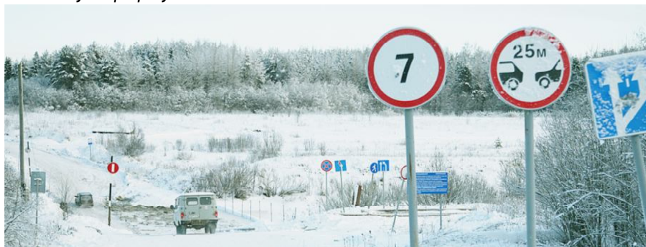
О строителях ледовой переправы читайте в следующем номере газеты.