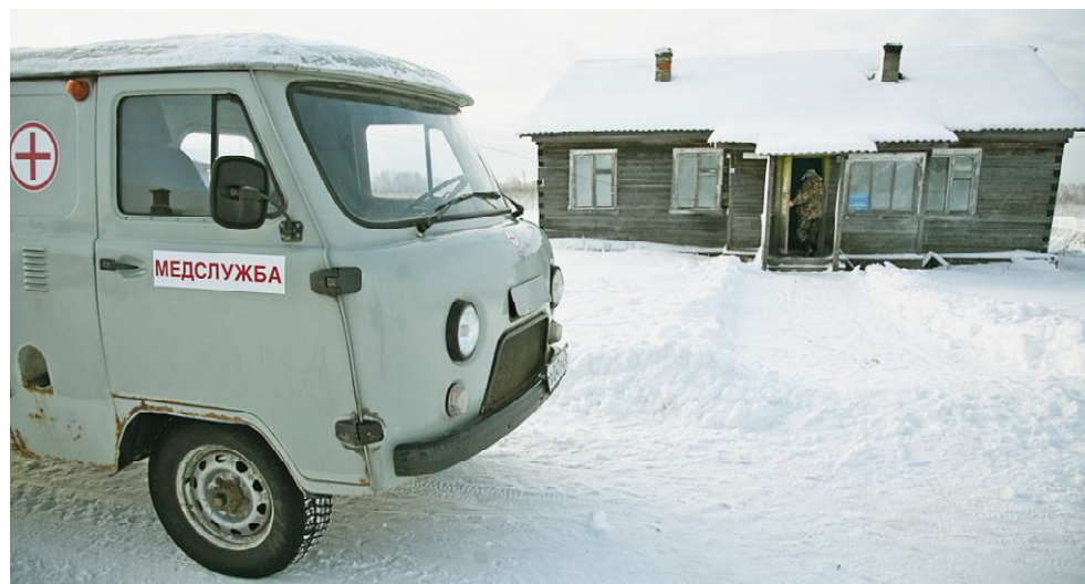
Фельдшерско-акушерский пункт в Вальге стал доступен, благодаря усилиям многих жителей, участвовавших в его ремонте, устроивших ледовую переправу.