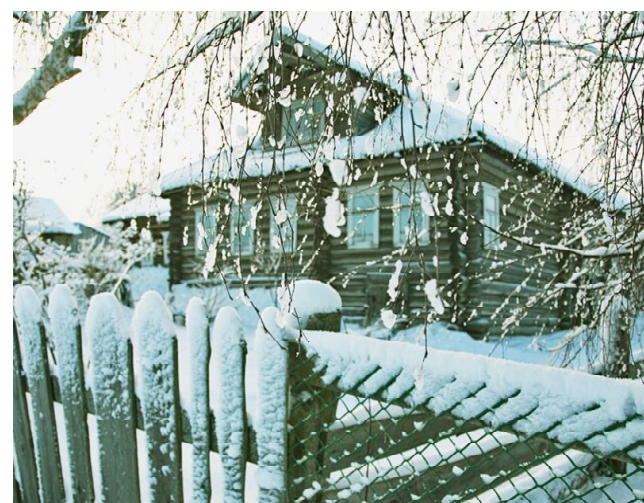
В красивом доме жизнь не может быть иной.