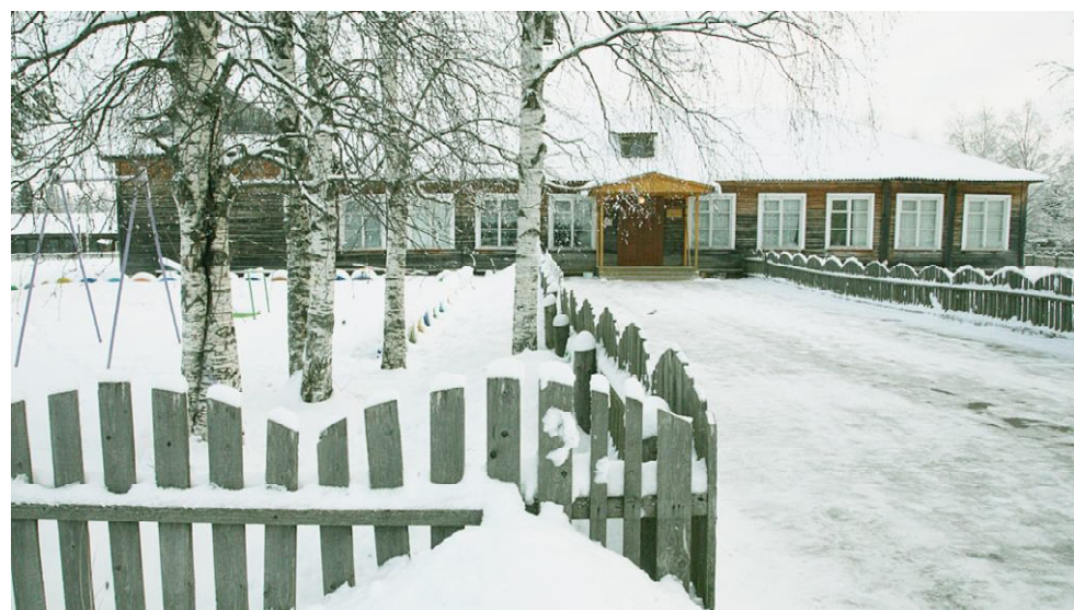
Репортаж о лыжных соревнованиях из Гремячинской школы читайте в следующем номере «Восхода».