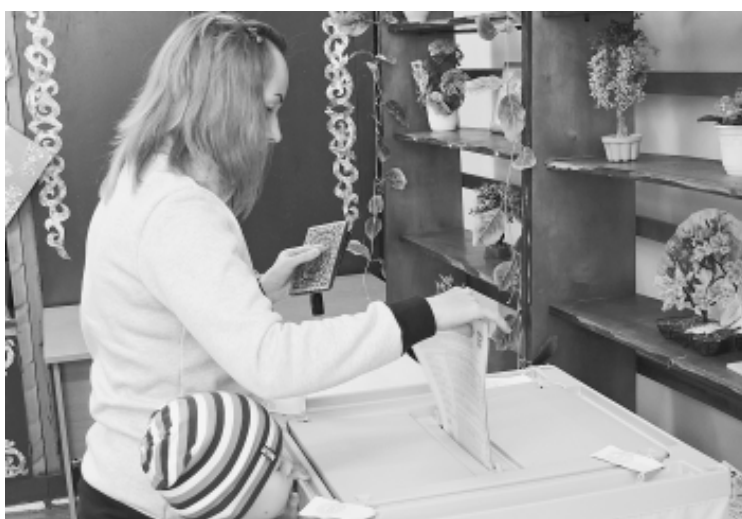
Участок 35.85.091 (Ногинское поселение).