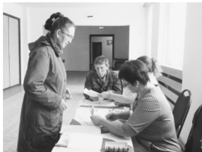
Участок 35.85.092 (Раменское поселение).