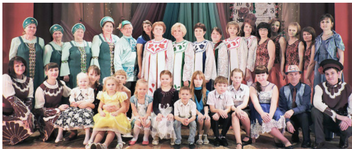
Участники праздничного концерта.