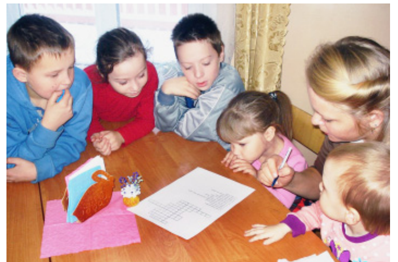
Разгадывание кроссворда - дело увлекательное.