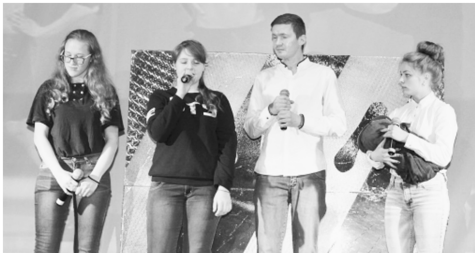
Выступление команды «Тинейджеры».

Валентина БЕЛЯЕВА. Фото из архива команды.