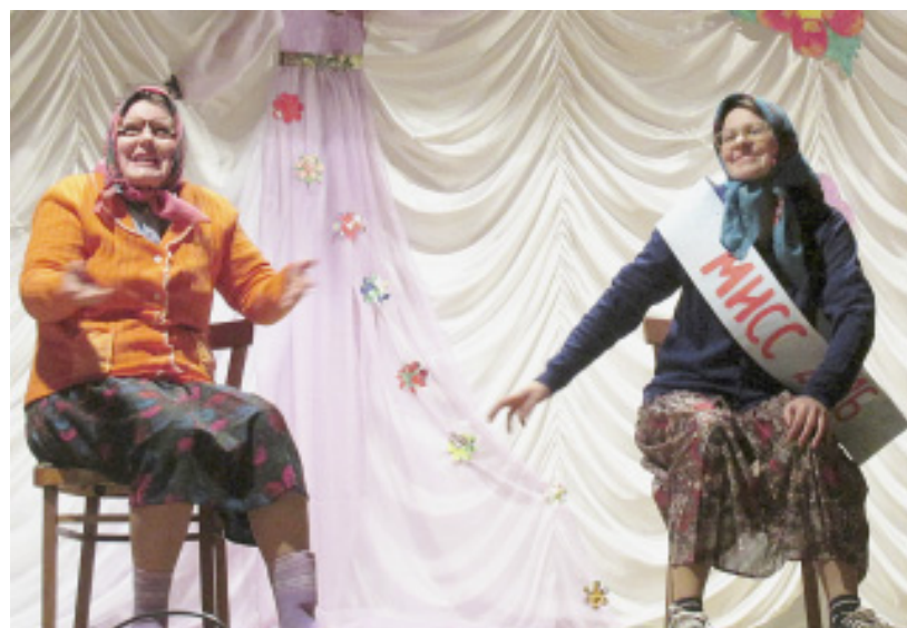
Весёлые сценки заслужили самых громких аплодисментов.

- под таким названием накануне Дня матери в Гремячинском Доме культуры состоялся праздничный концерт самодеятельных артистов из Двиницы.