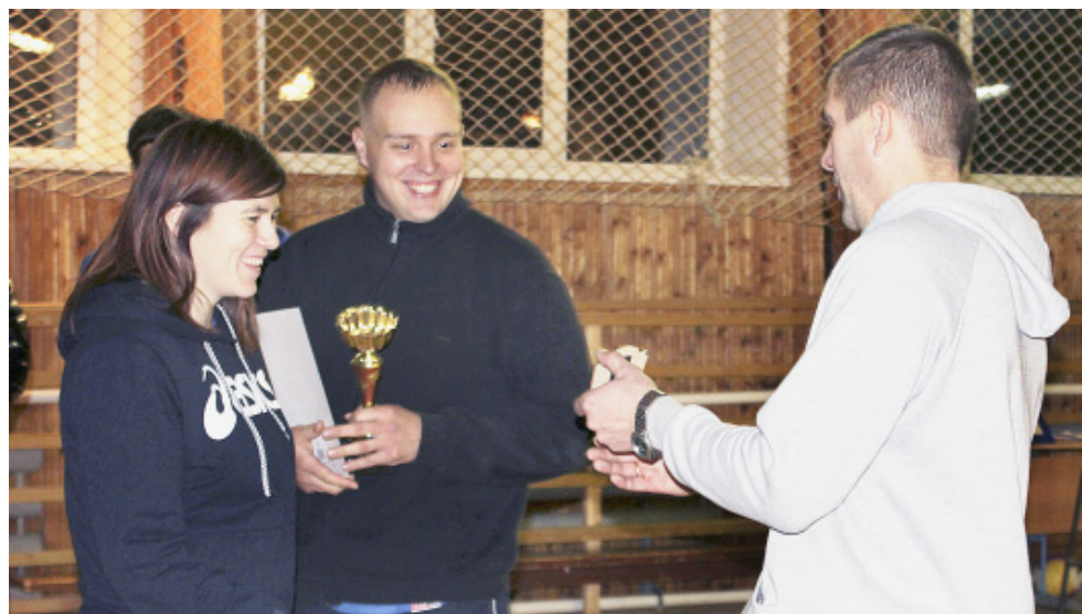
Награждение победителей турнира.