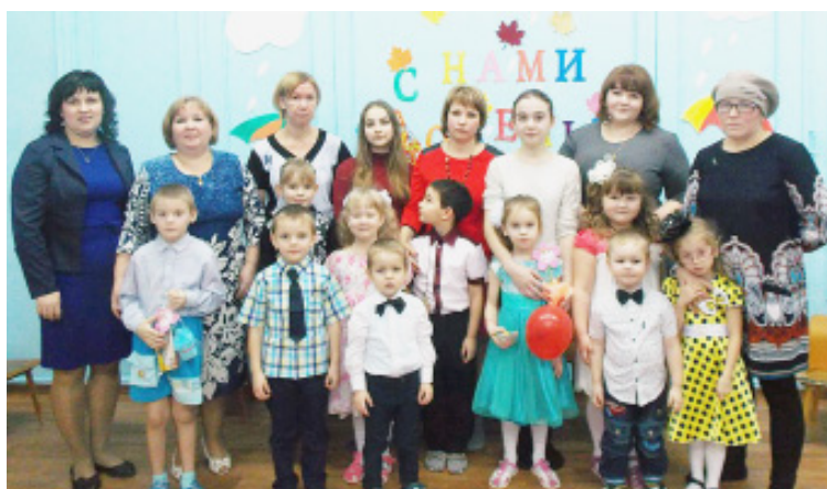
Воспитанники дошкольной группы с мамами.

Традиционный детский утренник, посвящённый Дню матери, прошёл в дошкольной группе 25 ноября. К одному из самых любимых и значимых праздников дети готовились заранее: разучили новые песни, стихи, танцы, приготовили своими руками подарки для любимых мамочек. В зале была тёплая праздничная атмосфера, исходящая от нежных улыбок и сияния счастливых детских глаз.