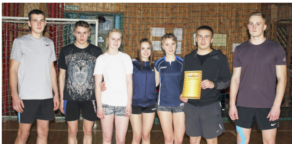
Команда «Сямжа-2», занявшая второе место.