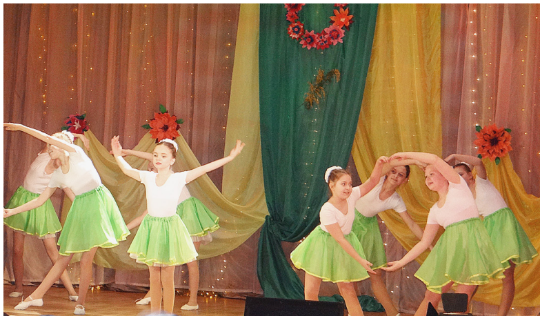
Хореографический коллектив «Арлекин».