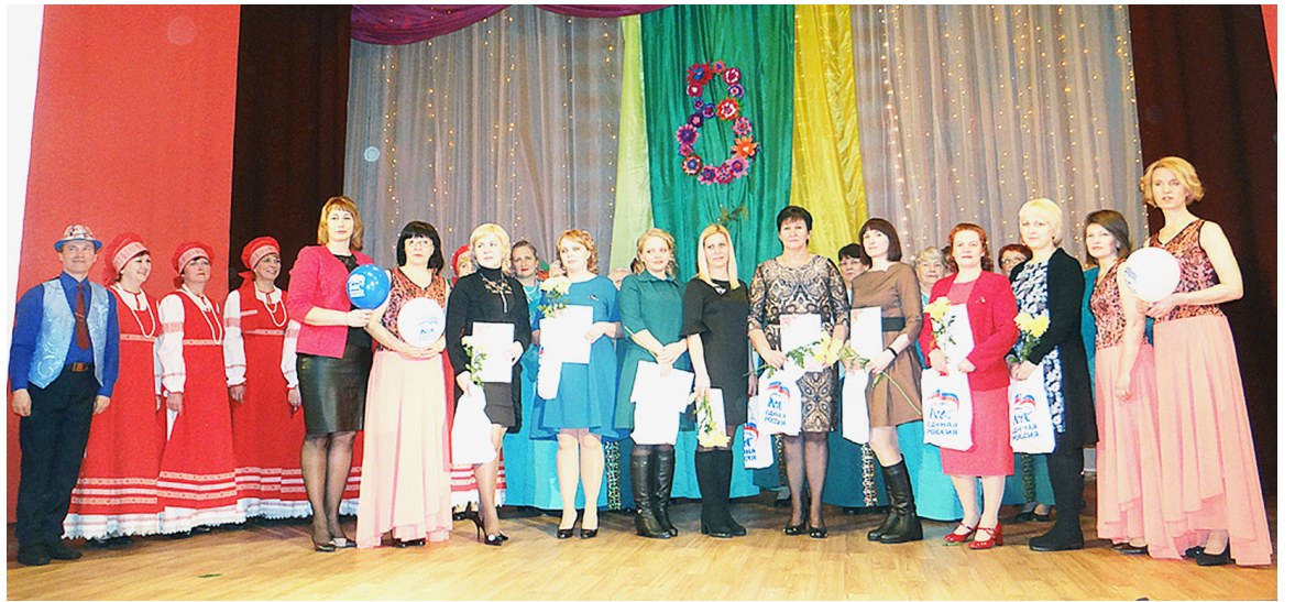
В завершение концерта участники и номинанты сделали совместное фото на память.