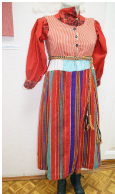
Традиционный народный сямженский костюм.

Материал подготовлен при поддержке Управления информационной политики Правительства Вологодской области.