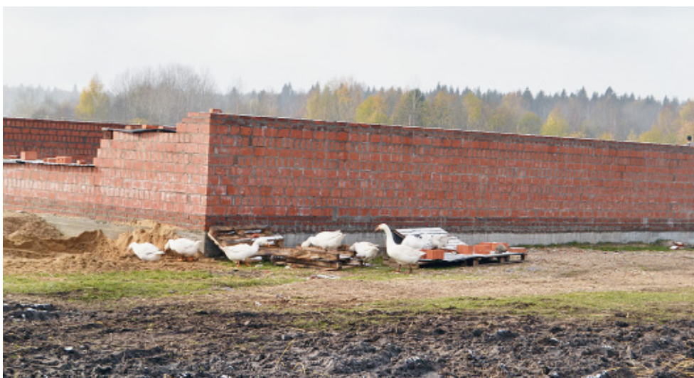
У стен новой фермы.