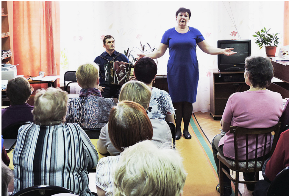
Льётся песня душевная, звонкая...

После завершения программы зрители ещё долго не отпускали супругов "со сцены", просили спеть ещё и ещё. Дружные аплодисменты, не смолкавшие на протяжении всего концерта, стали искренней благодарностью за прекрасный вечер и