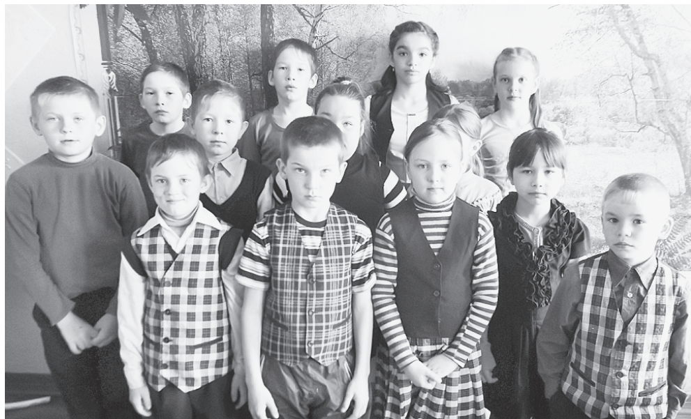
Дети из кружка "Краевед".

2017 год объявлен Годом экологии в России. В нашей библиотеке прошло уже несколько мероприятий, посвящённых этой теме.