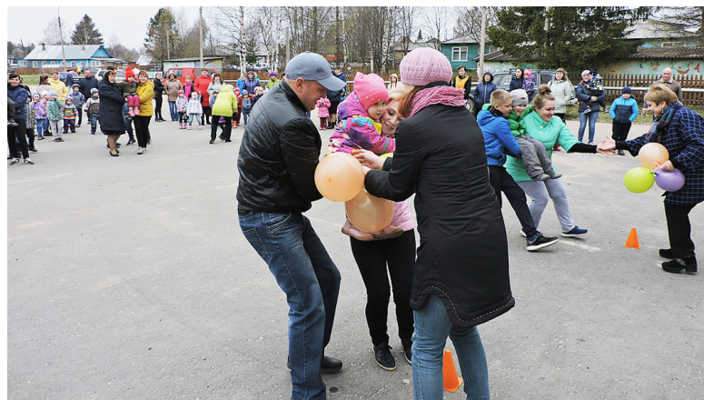
Весёлая эстафета «Поход в магазин».