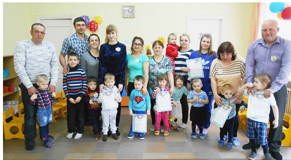
Спорт - здоровье, здоровье - любовь, а любовь - это семья!

рошо продуманы все этапы этого увлекательного соревнования в соответствии с возрастом и физическим развитием детей, подобран необходимый спортивный инвентарь.