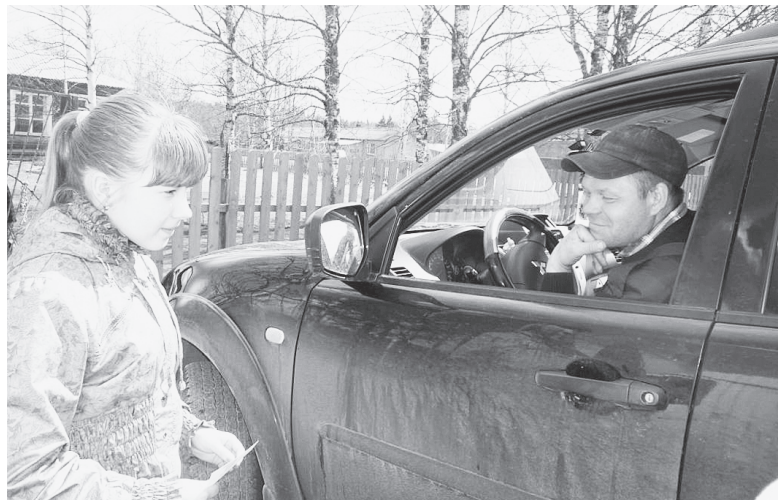
Что значит для вас разумная скорость? - вопрос, который был задан водителям.