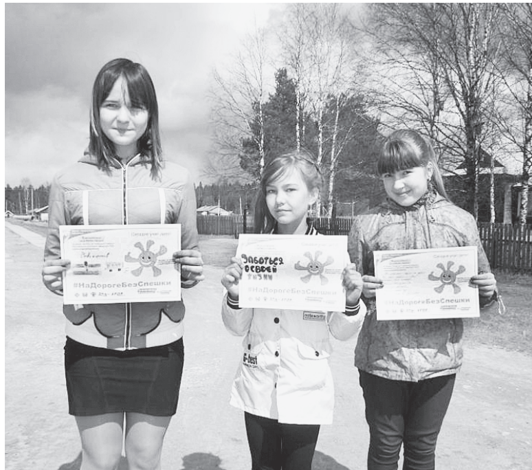
Ученицы 6 класса. Акция на дороге.