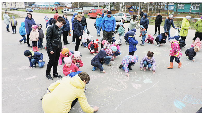
Мы рисуем на асфальте разноцветными мелками...