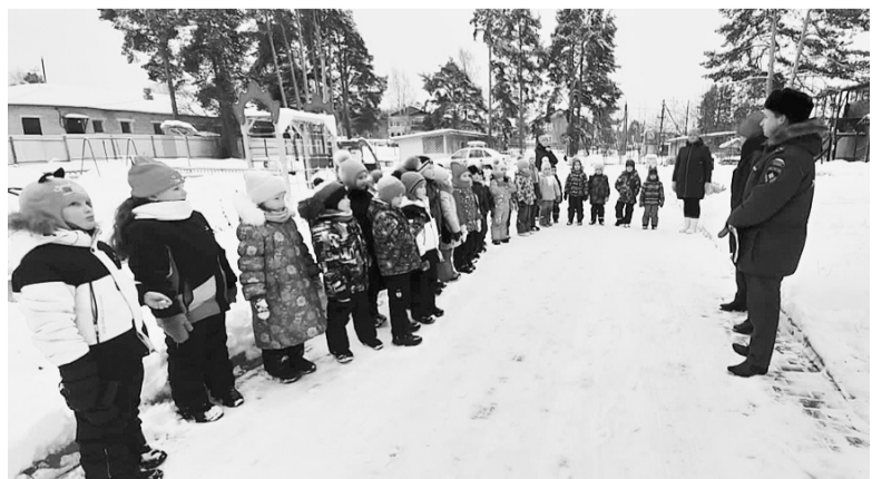
Соблюдение несложных рекомендаций позволит встретить долгожданный праздник безопасно.

Алиса РАШЕВСКАЯ. Фото из группы ВКонтakte «ОНД и ПР по Сямженскому и Верховажскому районам».