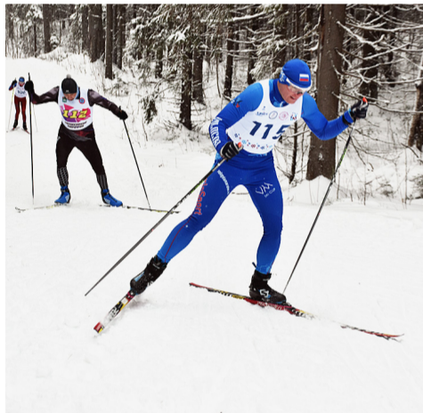
Нелегко спортсменам давалась работа на подъеме.

и слезы уже после завершения гонки. В контактных видах спорта такое случается зачастую, и все эти моменты отправятся туда же — в копилку, где хранится опыт.