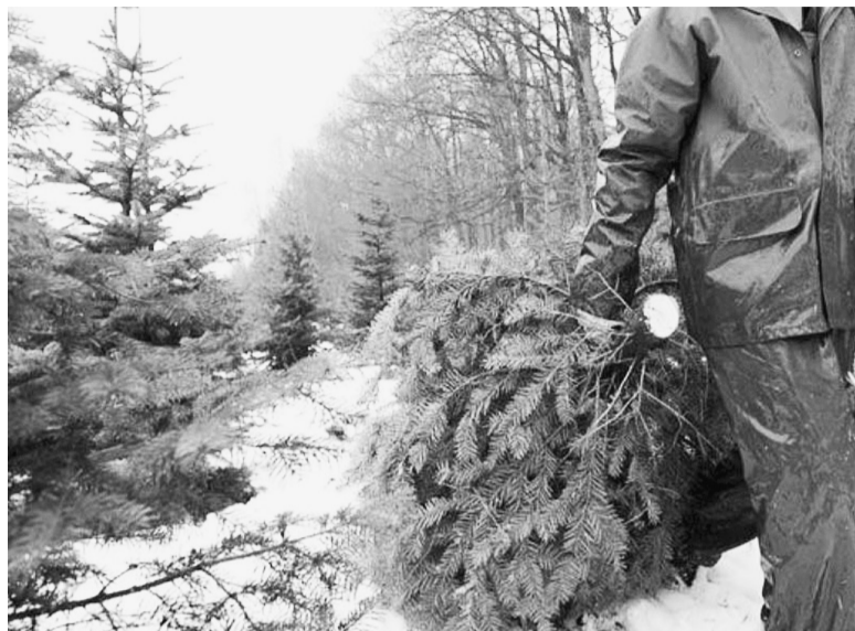
Самостоятельная вырубка гражданами деревьев является правонарушением, вне зависимости от величины и количества заготовленных деревьев.

Согласно КоАП РФ наказывать за лесонарушение могут и должностное лицо. В этом