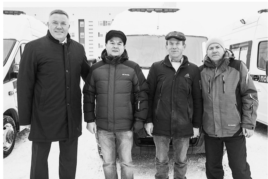
Автомобиль, оснащенный всем необходимым специализированным оборудованием, будет использоваться для перевозки экстренных больных в медучреждения областного центра.

Восемьдесят две машины скорой помощи и санитарных автомобиля отправлены в округа и районы области на этой неделе. Они были закуплены за счет средств федерального и областного бюджетов. Счастливым обладателем новой «ГАЗели Next» стало и главное медучреждение нашего района.