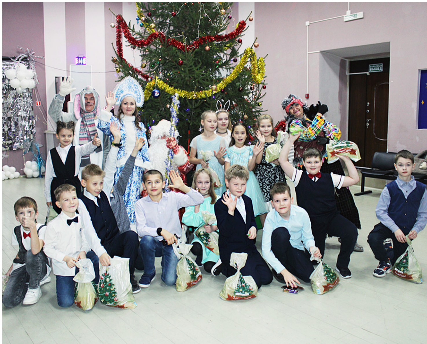
Школьники с героями новогодней сказки желают всем счастливого Нового года.

Сюжет зимней сказки на этот раз был завязан на коварном зелье лесной жительницы, которая обратила