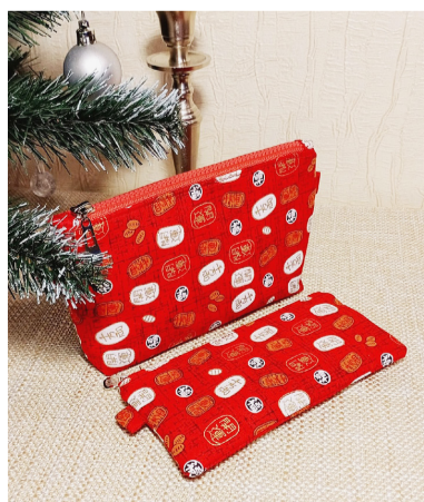
Яркие косметички ручной работы.