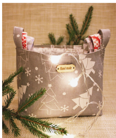
Новогодние корзинки из текстиля.

Екатерина ТИХОМИРОВА.