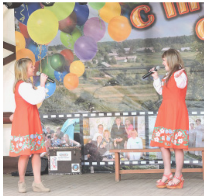
На сцене участницы из Двиницкого поселения.