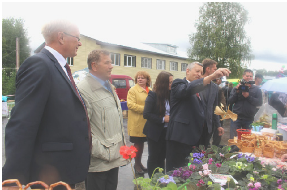
Посещение выставки «Мастерами славен наш Сямженский край».