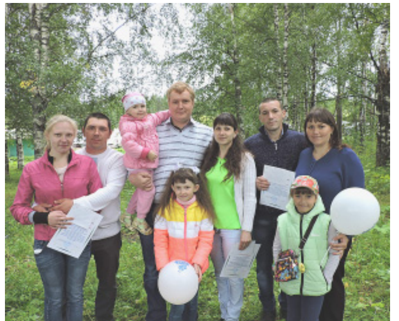
Семьи, в которых недавно произошло прибавление.