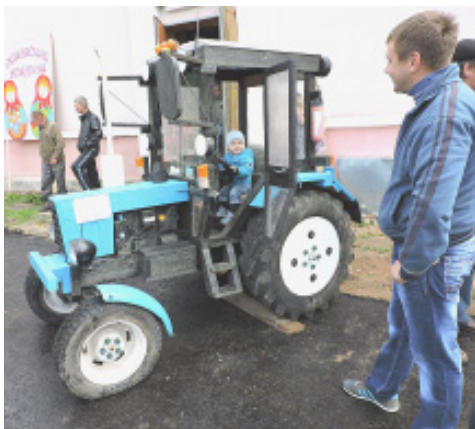
Чудо-чудное - трактор из дерева.