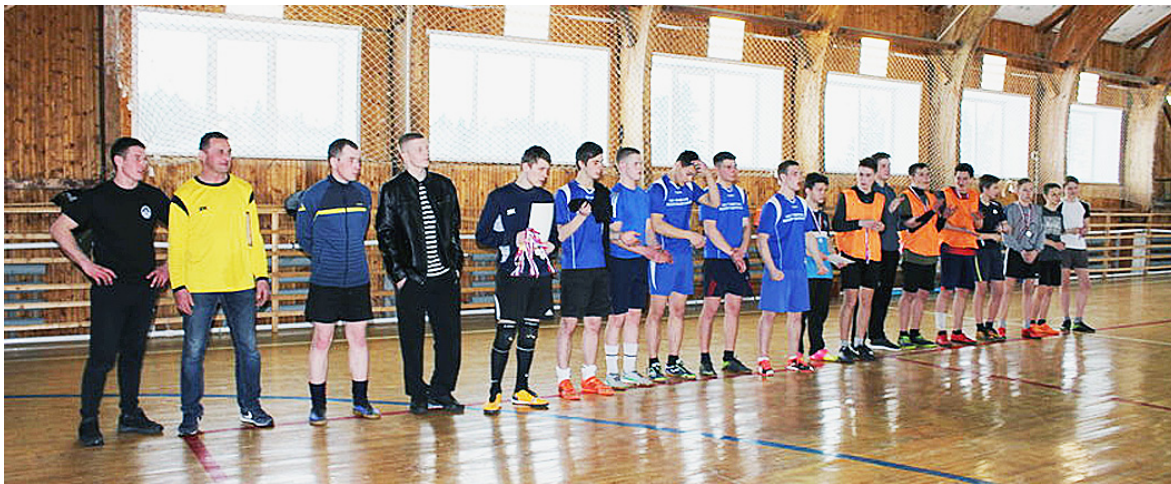
Подведение итогов и награждение победителей.

Во второй группе "Полиция" уверенно переиграла "Мастер" со счетом 6:3 в первом матче и, выходя на второй матч со "Школой", настолько расслабилась, что долгое время проигрывала. Во втором тайме "По-