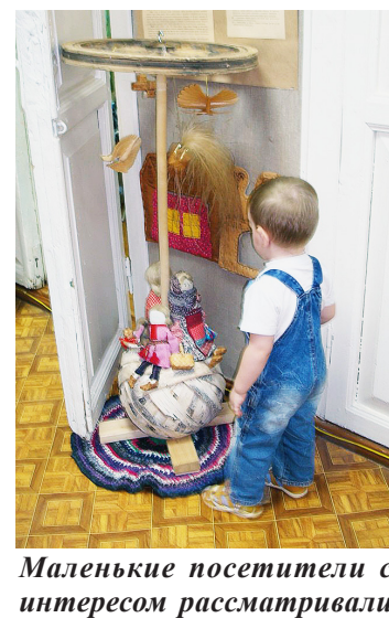
Маленькие посетители с интересом рассматривали экспонаты музея.