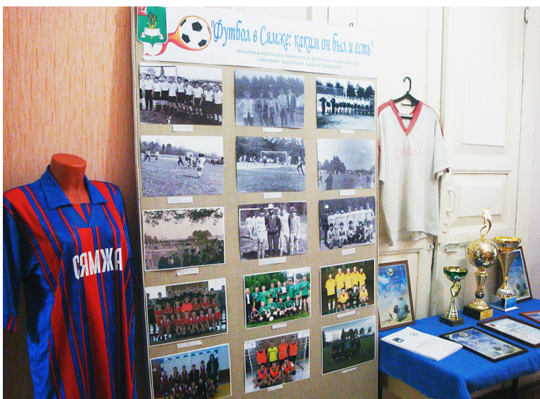
"Футбол в Сямже: какой он был и есть".