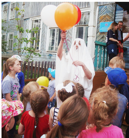
В самый разгар танцев появился Музейный Призрак.