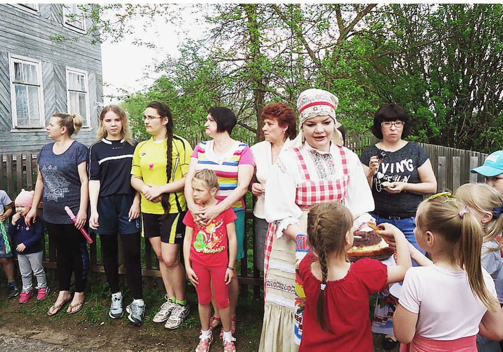
Гостеприимные хозяйки музея встретили посетителей хлебом-солью и поведали о программе "Ночного музейного квэста".

на "Творческих площадках". И взрослые, и дети с большим интересом, азартом и усердием учились у Елены Колокольцовой делать поделки в технике сухого валяния из шерсти. Под руководством Ольги Орловой постигали секреты песочной графики и создавали свои уникальные картины из песка на специальном столе для песочной анимации. А на станции "Раскрась музей" все желающие могли раскрасить эскиз музея цветными карандашами, в итоге музей получился ярким и разноцветным.