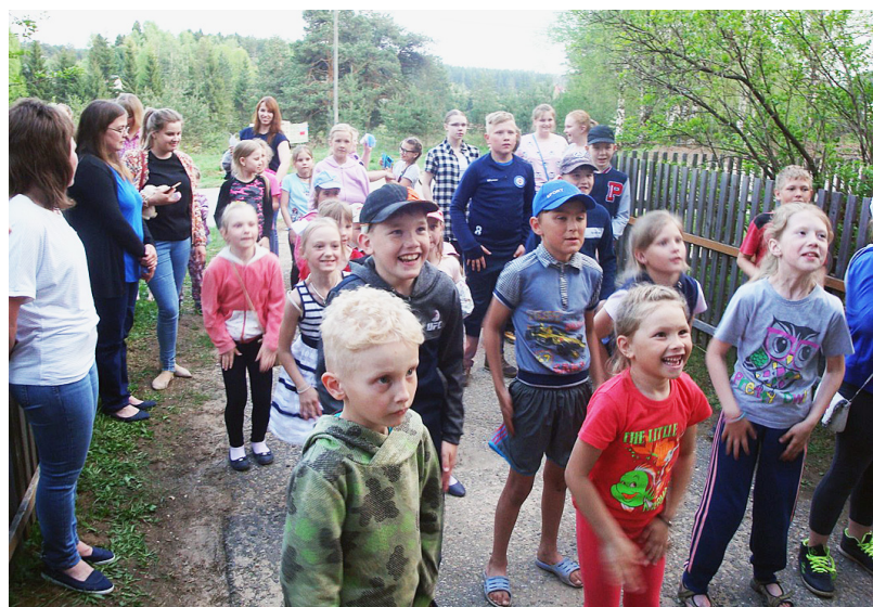
Кульминацией "музейной ночи" стал танцевальный флешмоб.