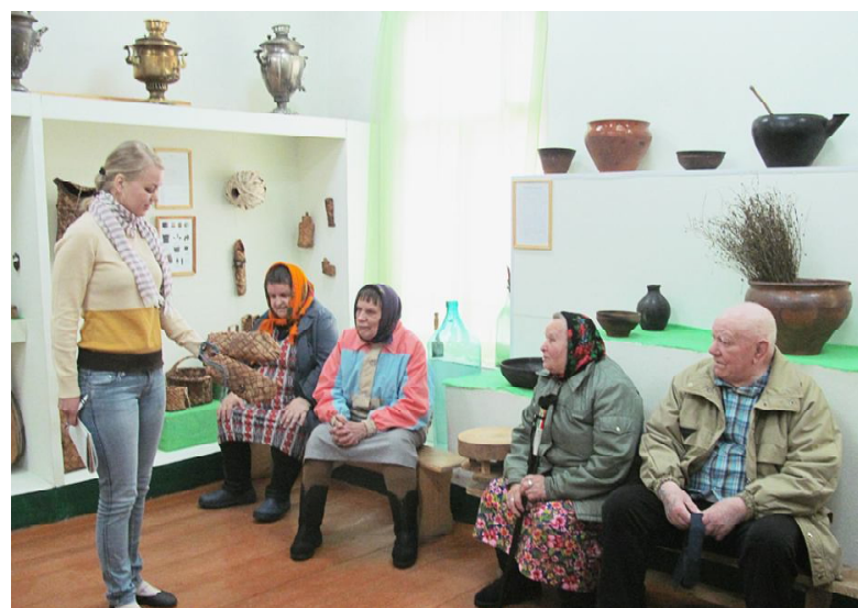
В районном краеведческом музее.