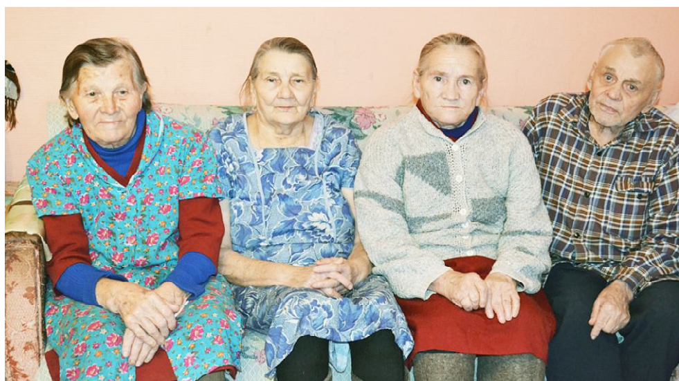
Бабушки рядышком с дедушкой.