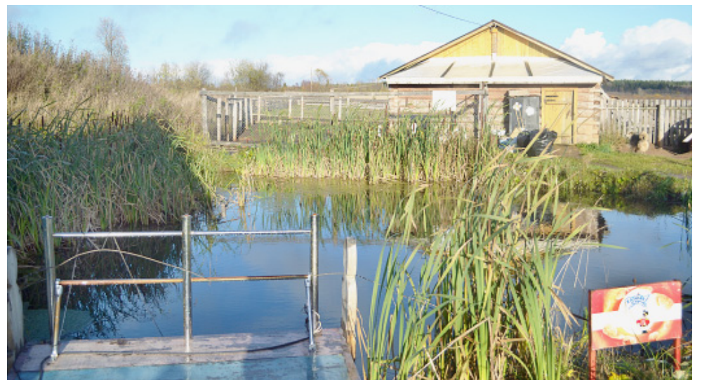
Вид на ферму Виктора Подосёнова.

Анна ТИМИНА. (Начало. Окончание в следующем номере).