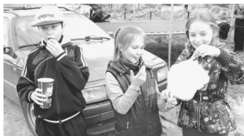
Дети лакомились вкусной сладкой ватой и попкорном.