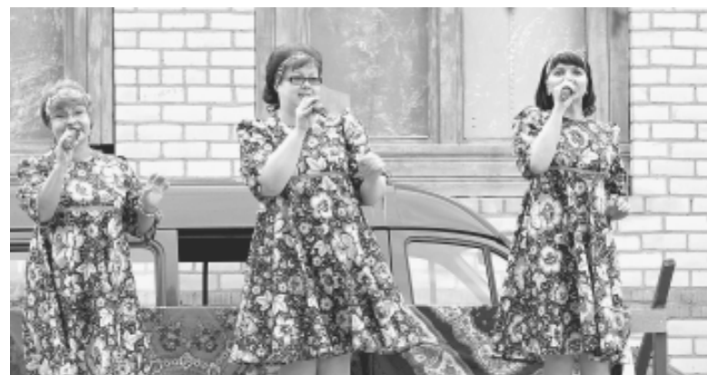
Трио "Напевы" (особое восхищение вызвали яркие, красивые наряды участниц, сшитые Ольгой Клоповой).