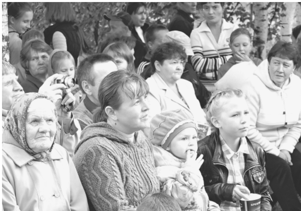
Жители и гости деревни по доброй традиции собрались на площади у Центра культуры.