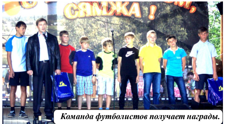
Команда футболистов получает награды.

В итоге победителем признано сельское поселение С я м ж е н с к о е . Спортсмены поселения одержали убедительную победу над соперниками в пляжном волейболе, мини-футболе, дартсе и в беге на четыреста метров.