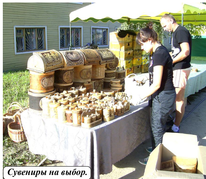
Сувениры на выбор.

Второе место присуждено сельскому поселению Ногинское, спортсмены которого стали призерами практически во всех видах спорта.