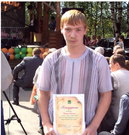
За отличные знания - благодарность.