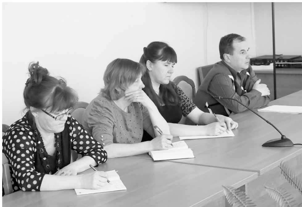
На заседании комиссии.