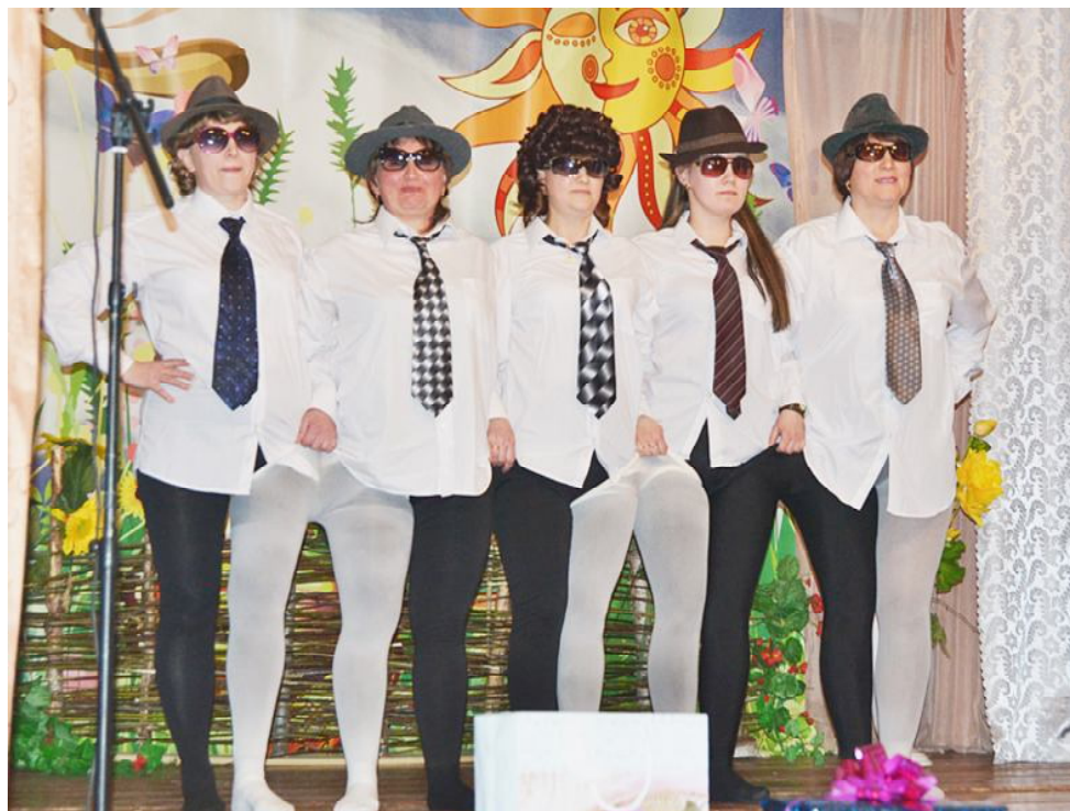
На сцене - гремячинская команда «Гламур».