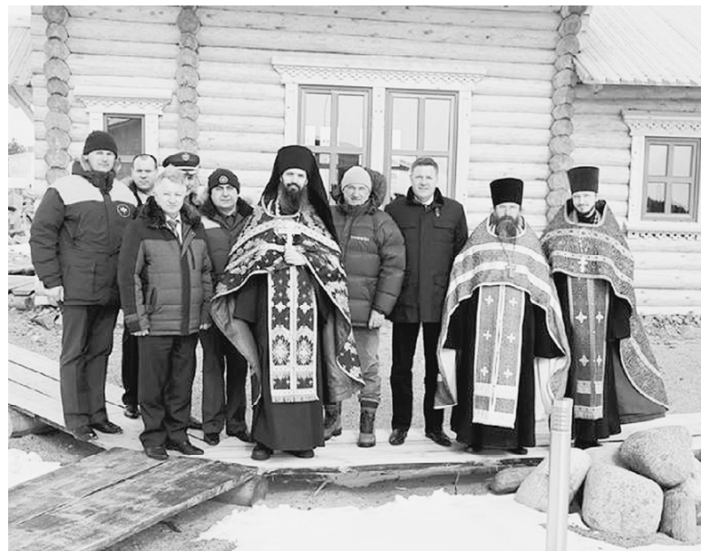
Участники чина освящения.