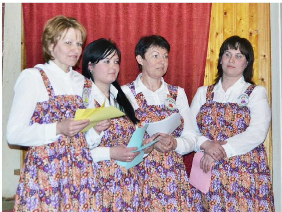
К выступлению готовятся двиницкие девчата.

Валентина СОКОЛОВА.