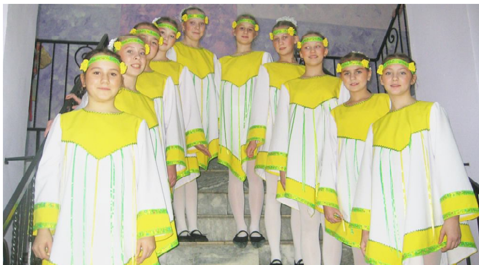
Учащиеся шестого класса хореографического отделения ДШИ.