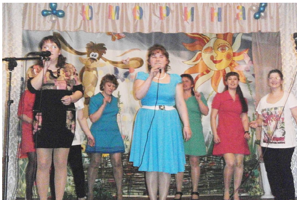
Выступают гремячинские участницы.

Необычный салат в виде лесной полянки с шалашом представили шелотяночки. Прекрасное представление самого обычного салата оливье от "Двиницких девчат" прозвучало так, что многим зрителям захотелось его попробовать. А когда каждое блюдо пронесли по зрительной-