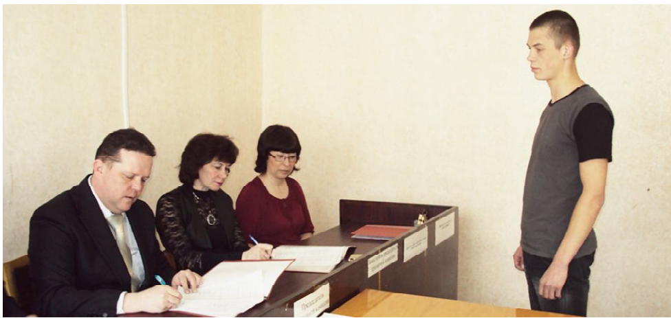
Идёт заседание призывной комиссии.

Материал подготовлен при поддержке управления информационной политики Правительства Вологодской области.