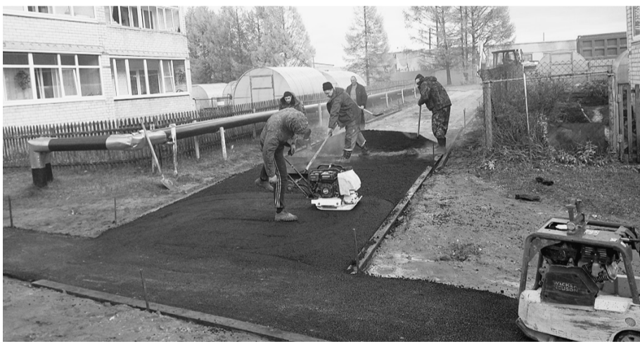
Рабочие сделали асфальтированный автомобильный подъезд к дому и пешеходные дорожки.

Завершилось благоустройство двора на улице Парковой. Жители двух соседних домов (№6 и №8) стали участниками программы «Комфортная городская среда». Большинство из них живет тут много лет и всей душой болеет за свои дома. Они не нарадуются положительным переменам и готовы положить все силы, чтобы довести двор до совершенства.