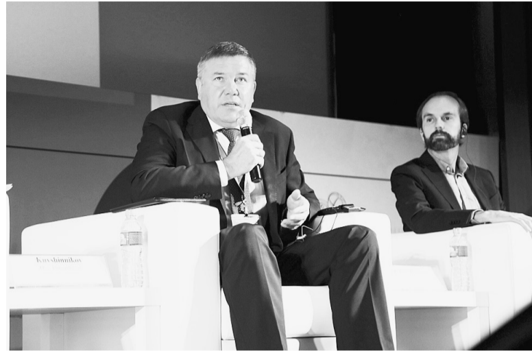
Общественное здоровье должно стать национальной идеей, стратегией. Без здорового населения создать экономически мощное государство невозможно.