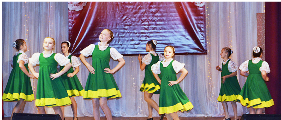
На сцене учащиеся хореографического отделения ДШИ.