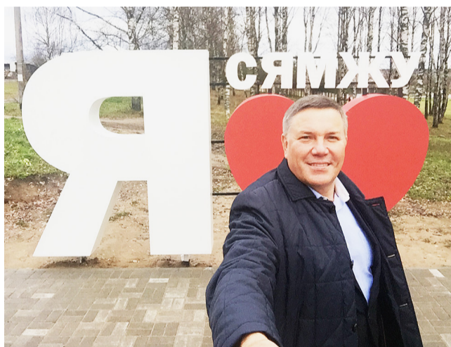
Селфи на память на фоне нового арт-объекта.

О грамотном расходовании средств говорил губернатор и когда