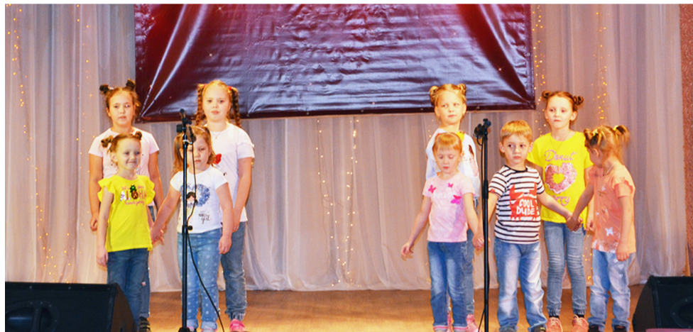
Выступление вокальной группы «Аленушка».

«Я хожу практически на все концерты и постановки нашего Центра культуры, мне очень нравится, особенно сама атмосфера, предвкушение