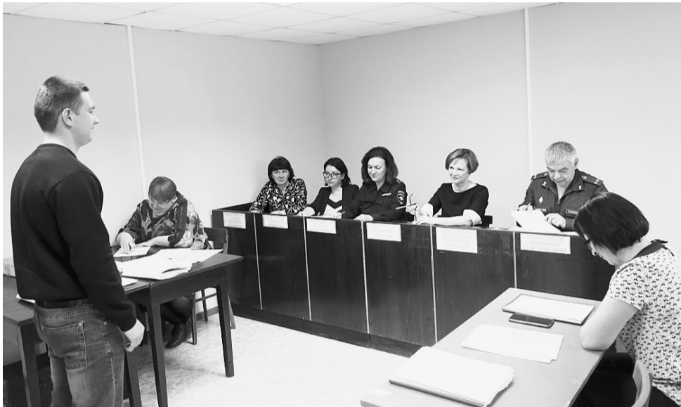
Первые отправки на сборный пункт Вологодской области назначены на тринадцатое ноября.

С первого октября началась осенняя призывная кампания, которая продлится до тридцать первого декабря текущего года. Призыв в армию — это комплекс мероприятий, включающих в себя явку на медицинское освидетельствование и заседания призывной комиссии, а также в указанные в повестке военного комиссариата время и место для отправки к месту прохождения военной службы.