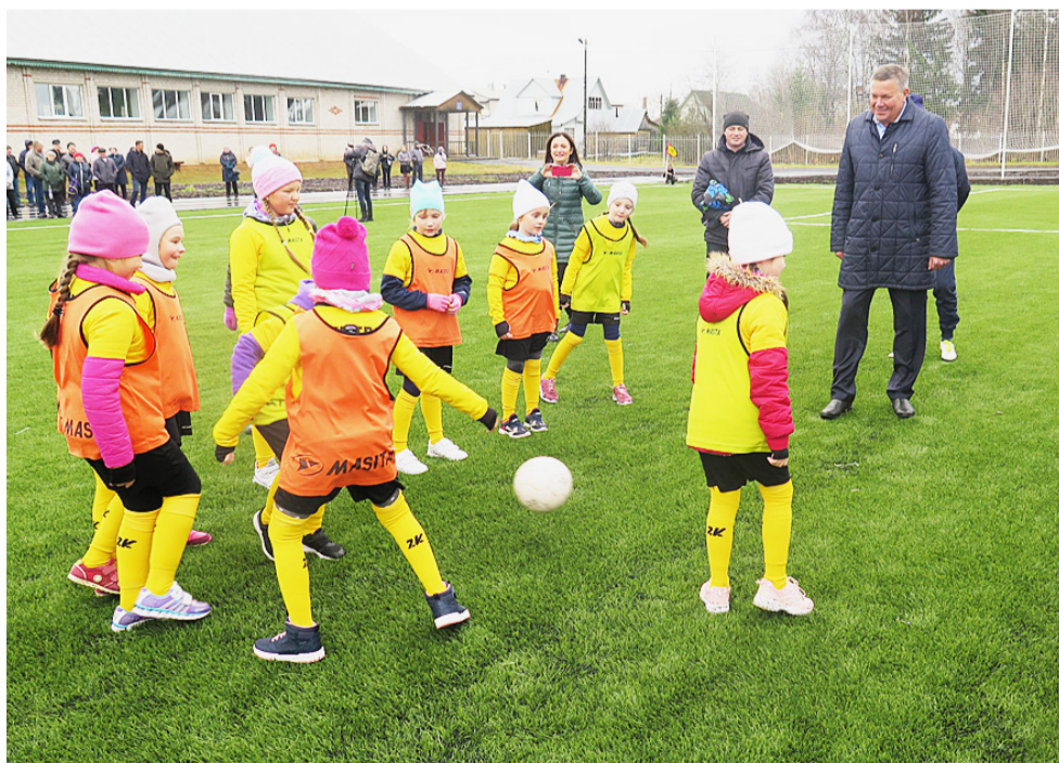
Качественное футбольное поле с искусственным покрытием дает огромный толчок к развитию спорта в области.

По информации пресс-службы губернатора Вологодской области к печати подготовила Ирина МАКАРОВА.