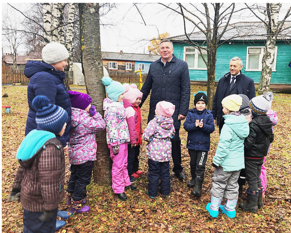
Одно из решений второго Градостроительного совета — капитальный ремонт Детского сада №1.