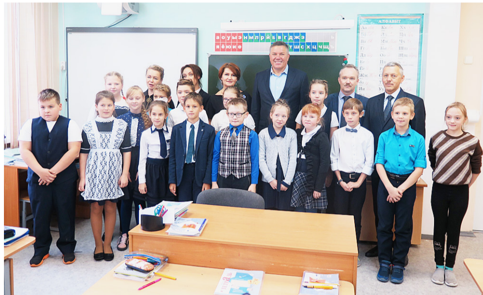
В отремонтированном здании начальных классов стало тепло, уютно и светло.

инспектировал ремонт помещения Районного Центра Культуры и прилегающей к нему территории. Олег Кувшинников отметил органичность «ансамбля», в который теперь входят сцена с удобными скамейками для зрителей и площадка с арт-объектами.