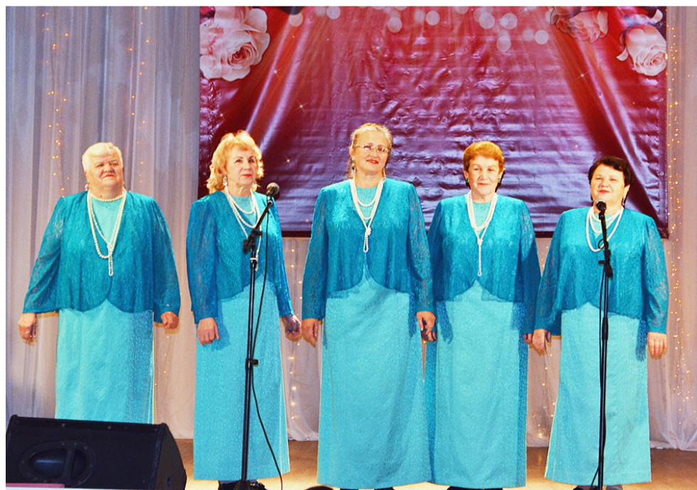
Ансамбль РЦК «Любо-дорого».

чего-то необычного и, безусловно, очень интересного. Так случилось и в этот раз – программа была довольно разнообразной и увлекательной, я даже не заметила, как пролетело время, считаю, что такие мероприятия – это замечательный досуг на селе. Все