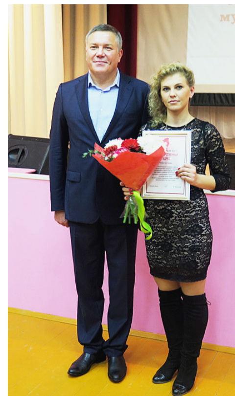
В рамках Градсовета наградами Губернатора отмечены жители райцентра.

Подробности читайте в следующем номере газеты.