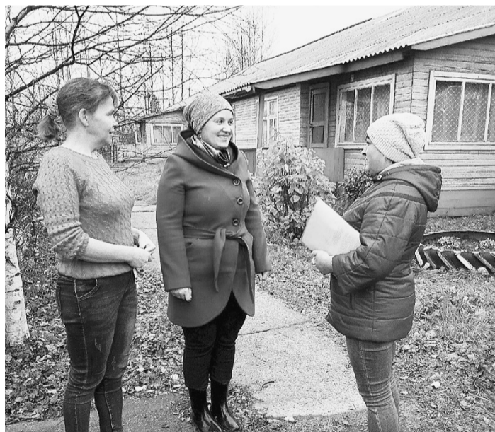
Мобильные бригады созданы при каждом комплексном центре социального обслуживания. Задача команды специалистов — вовремя выявить те проблемы, которые появляются у сельских жителей.

«Соответствующий порядок на территории Вологодской области уже принят. Ежемесячно учреждения здраво-