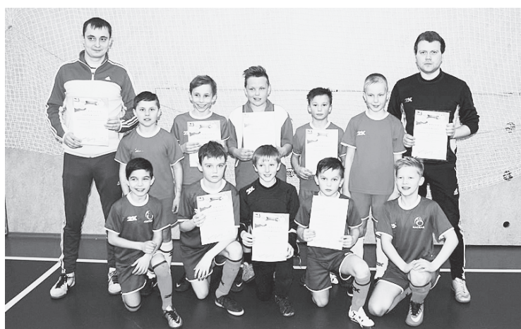
Команда "Спартак" (Сямжа-Вожега) заняла 4 место из 12 команд.