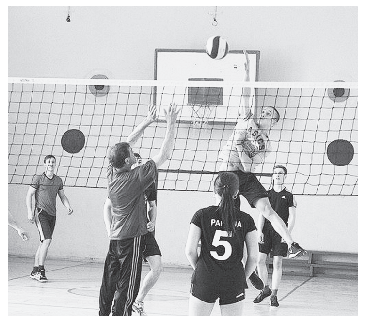
На площадке команды «Ветераны» и «Школа».

В спортивном зале Двиницкой основной школы 23 апреля состоялся кубок района по волейболу.