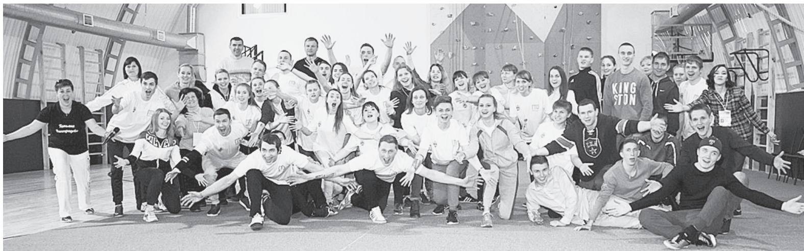
Волонтёры ГТО - представители студенчества и работающей молодёжи Вологодчины. К труду и обороне готовы!