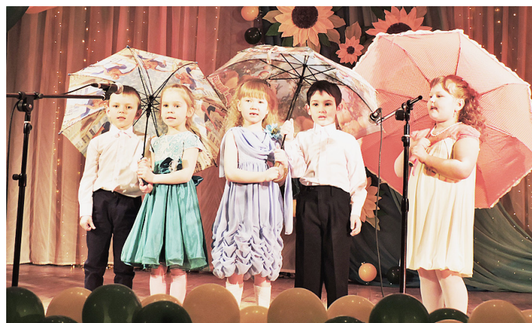
Песня "Дождик" в исполнении дошкольной группы Двиницкой школы.

дарования старались изо всех сил, конечно же, они волновались за кулисами, переживали, смущались, ведь выступать на большой сцене, а для многих это было впервые (особенно для ребят, приехавшим на фестиваль из Двиницы, Режи и Коробицына), дело - серьёзное, ответственное, тем более, что в зале сидели самые родные и любимые люди: мамы и папы, бабушки и дедушки, сёстры и