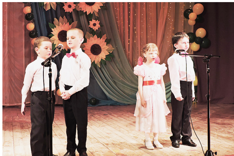
На сцене дети дошкольной группы Коробицынской школы.