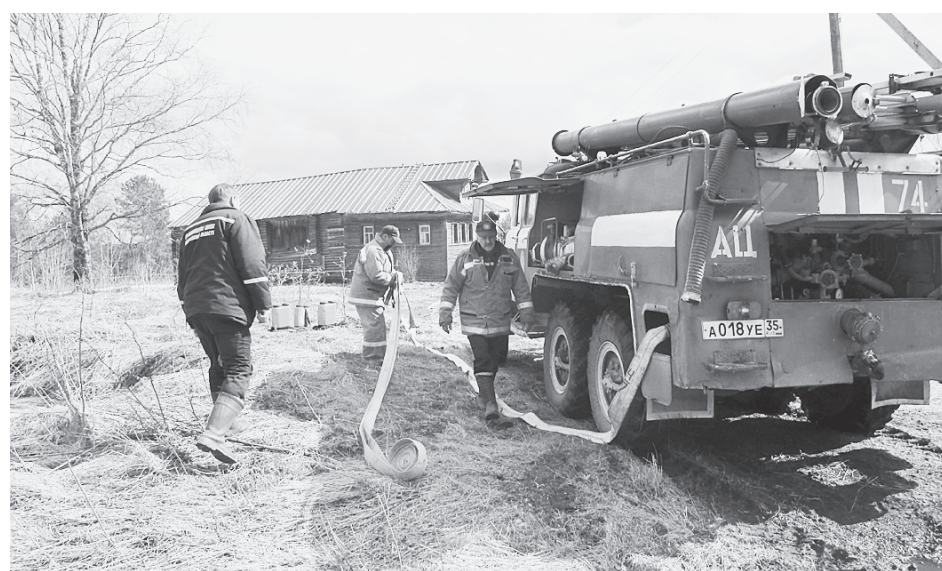
Фото из архива отдела.