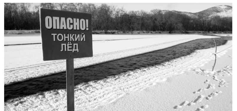
В случае появления типичных признаков непрочности льда: треск, прогибание, появление воды на поверхности льда — немедленно вернитесь на берег.

Оказывать помощь провалившемуся под лед человеку следует только одному, в крайнем случае, двум его товарищам. Скапливаться на краю полыньи большому количеству людей не только бесполезно, но и опасно. При спасении действуйте быстро, решительно, но предельно осторожно. Крикните, что идете на помощь. Подавайте спасатель-