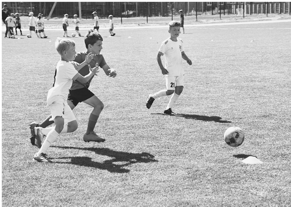
Минувшим летом один из этапов Первенства области по футболу среди детских команд 2013 г.р. прошел в Сямже.

Играли, играют и будут играть. Именно этими словами вкратце можно охарактеризовать любовь земляков к этому виду спорта. Дети и взрослые, мальчишки и девчонки любят попинать мяч на нашем новеньком, прекрасном стадионе или в зале, если говорить об осенне-зимнем периоде. Кстати, этот самый зал совсем скоро предстанет перед спортсменами в обновленном виде, и тренировочный процесс станет более комфортным. Если говорить о соревнованиях, проводимых на сямженской земле, то, возможно, их количество увеличится, ведь главной причиной отсутствия таковых были