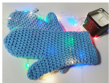
В свои работы рукодельница всегда добавляет некую изюминку.