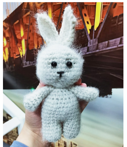
Милые игрушки, созданные мастерицей.

вязание для нее — своеобразная медитация.