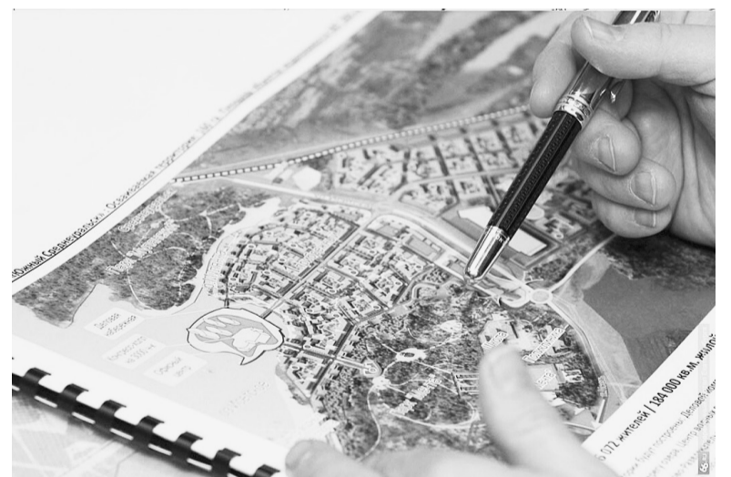
Информацию об объекте недвижимости, в т.ч. размер кадастровой стоимости, можно узнать на сайте Росреестра.

Кроме того, информацию об объекте недвижимости, в т.ч. размер кадастровой стоимости, можно узнать на сайте Росреестра в режиме онлайн с помощью сервиса «Справочная информация по объектам недвижимости в режиме online» ( https://rosreestr.gov.ru/eservices/request_info_from_egrn/ ), указав один из критериев поиска: кадастровый номер объекта недвижимости или адрес объекта недвижимости. Хотелось бы обратить внимание, что такая информация носит справоч-