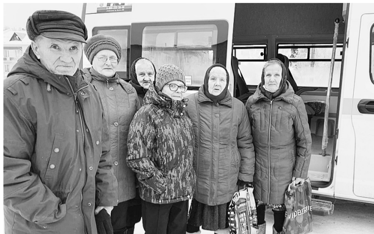
Жители Сямженского района в возрастной категории 60 лет и старше, проживающие в отдаленных деревнях, имеют возможность пройти диспансеризацию и сделать дополнительный скрининг на выявление неинфекционных заболеваний. Подвоз граждан организует КЦСОН.

«Очень важно регулярное обследование организма. Есть комплексы обследований, которые зависят от возраста и пола человека. Диспансеризация и профосмотры — это возможность предупредить такие тяжёлые заболевания, как