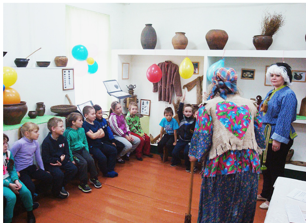
На игровой познавательной программе "Веселые уроки в музейном царстве".

пытания, с которыми первоклашки справлялись на "отлично": Музя проверил, как ребята умеют собирать в школу портфель, Яга загадывала сложные задачи, давала "вредные" советы и устроила для всех флеш-моб! Ещё ребята произнесли клятву первоклассника, в которой обещали быть достойными учениками, получать только пятёрки и слушаться учителей и родителей. А потом маленькие ученики посетили самые интересные уголки нашего музея - отделы природы, где познакомились с лесными и речными обитателями, рыбами, животными и птицами. И в конце праздника все насладились чаепитием с разными вкусностями, которое подготовили родители и классные руководители.