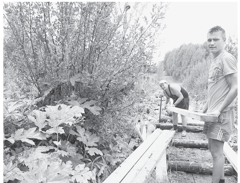
Деревянные мостки на улице Румянцева в райцентре удалось обновить также благодаря участию в проекте "Народный бюджет".