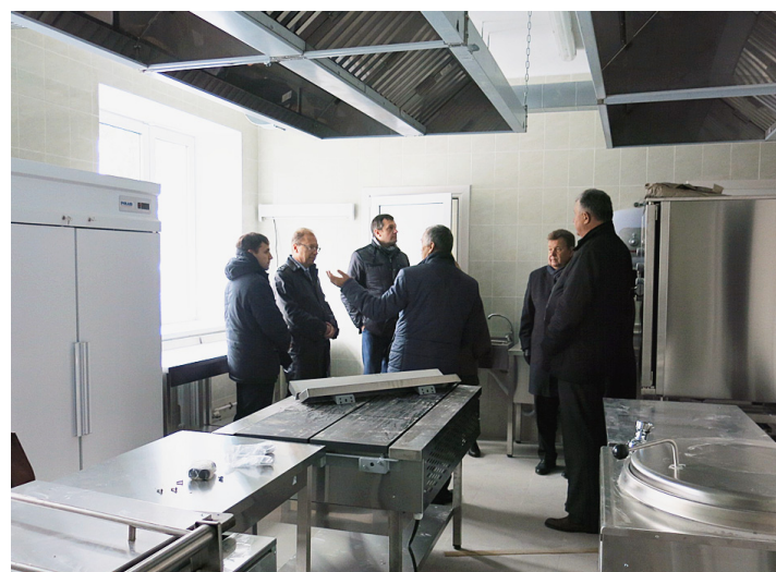
В самом современном пищеблоке детского сада.

С использованием материалов пресс-службы Законодательного Собрания Вологодской области.