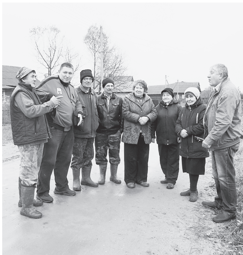
В деревне Олеховской.