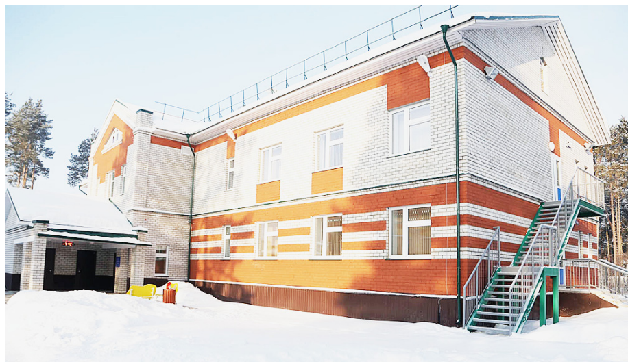
Здание нового корпуса детского сада № 2.