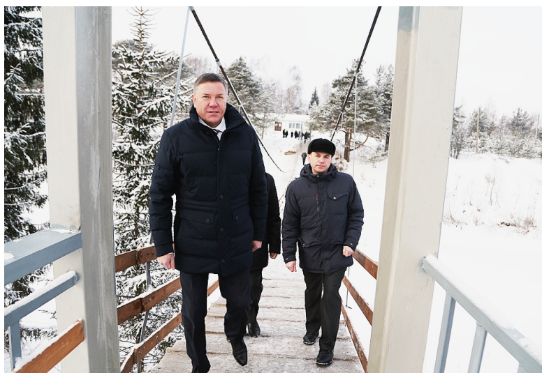
Пешеходный подвесной мост через реку Сямжена.

По материалам пресс-службы Губернатора Вологодской области.