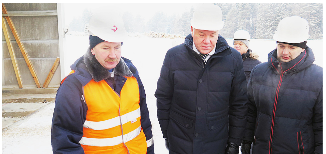
Глава региона проинспектировал ход реализации приоритетного инвестиционного проекта в области освоения лесов лесохозяйственного объединения "Вологдалесхоз".