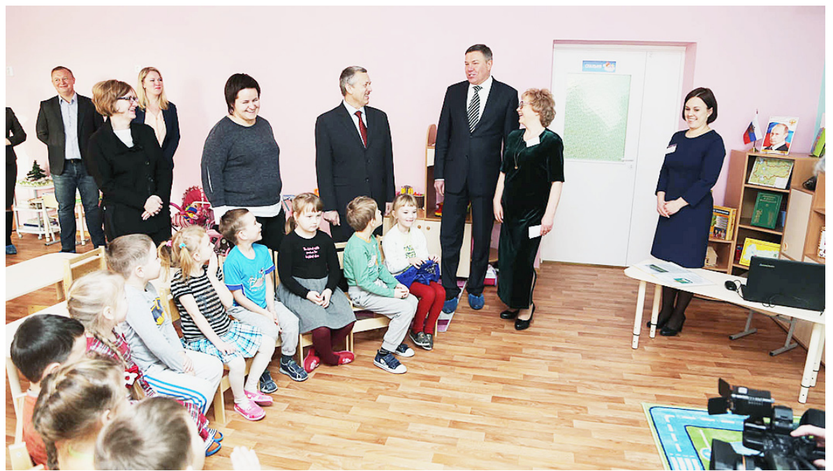
Олег Кувшинников посетил новый корпус детского сада № 2.

Глава региона также проинспектировал ход реализации приоритетного инвестиционного проекта в области освоения лесов лесохозяйственного объединения "Вологдалесхоз", включенного в этот список приказом Минпромторга РФ. Проект пре-