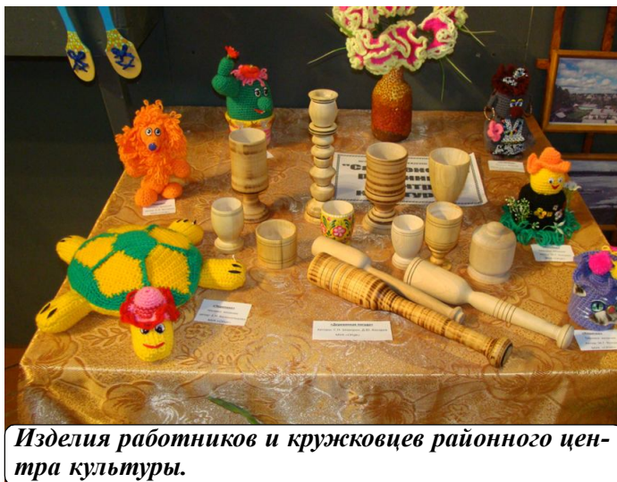
Изделия работников и кружковцев районного центра культуры.