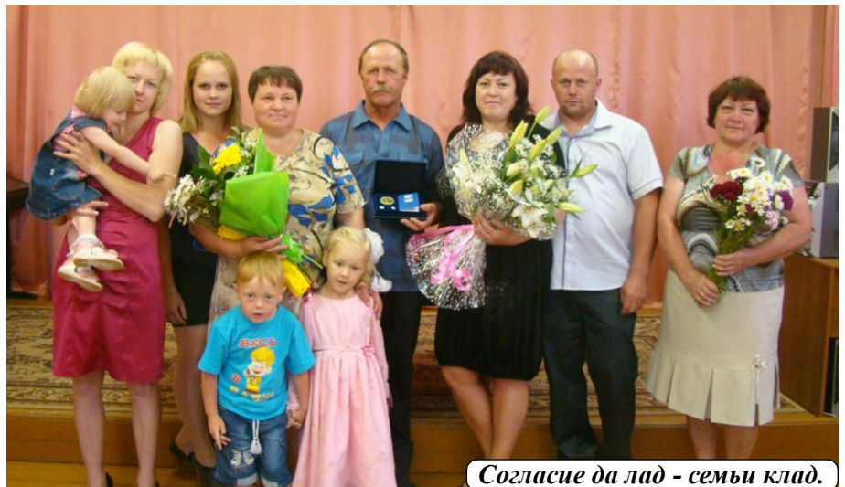
Согласие да лад - семьи клад.