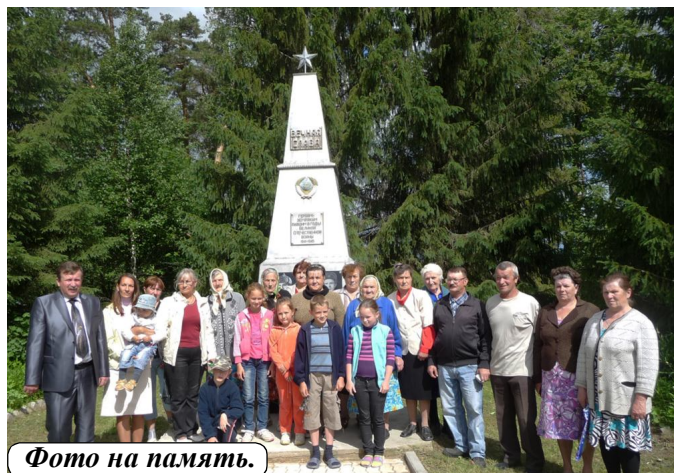
Фото на память.

Материал подготовлен при финансовой поддержке Комитета информационной политики Вологодской области.