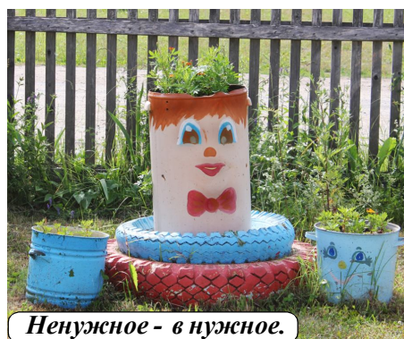
Ненужное - в нужное.