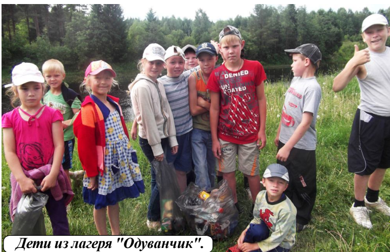
Дети из лагеря "Одуванчик".