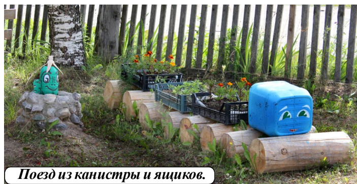
Поезд из канистры и ящиков.

Природа - это система, которая живет по определенным законам. Чтобы выжить, надо понять их и грамотно использовать, не превышая допустимого порога вмешательства в природные экосистемы.