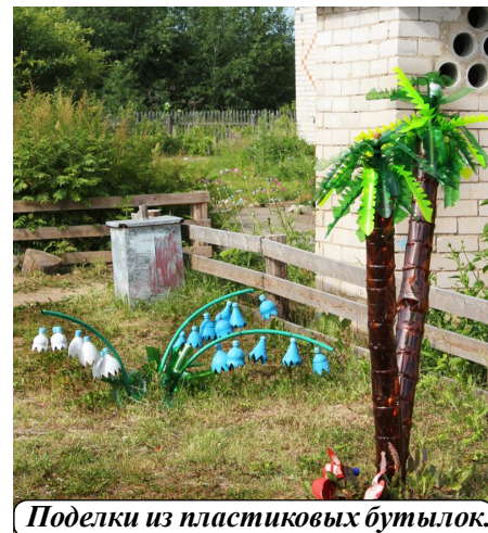
Подделки из пластиковых бутылок.

В краеведческом музее ребята участвовали в игре-путешествии "По лесным тропинкам отчего края". В течение всей смены дети взаимодействовали с окружающим миром, совершали экскурсии в природу, учились видеть ее красоту. Важную роль в экологическом вос-