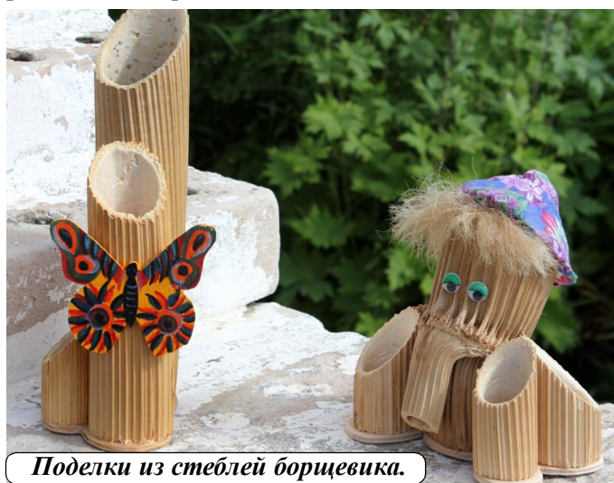
Поделки из стеблей борщевика.

новое применение этому растению. В апреле они со-