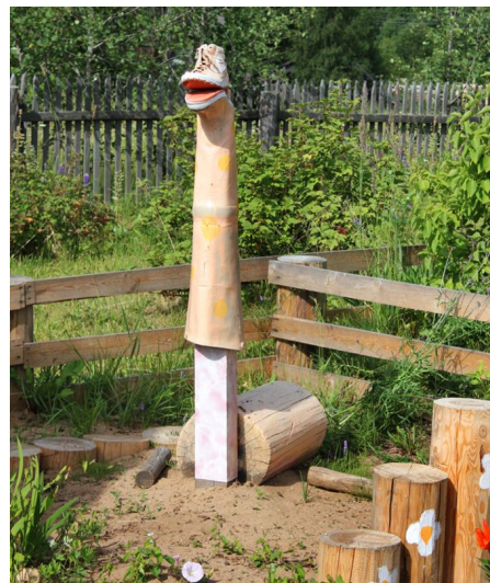
Удивительный жираф из обуви.

вали свои любимые уголки природы, которые молят о спасении. В работах были выражены искренние призывы беречь окружающую среду: "Берегите лес от пожаров",