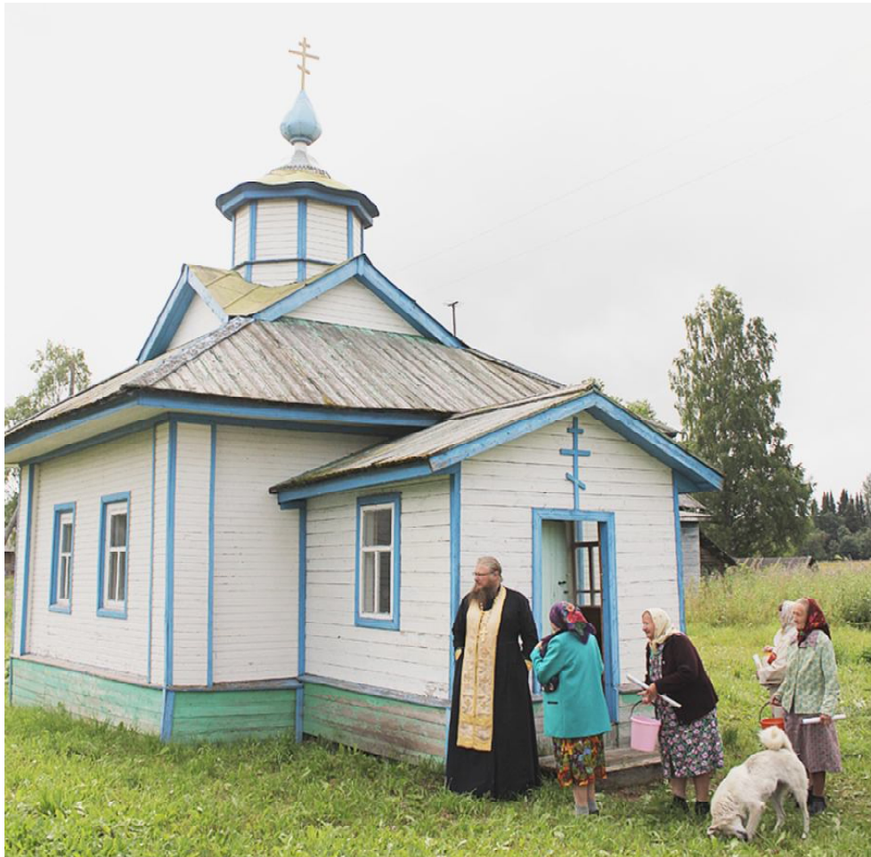
Возле часовни преподобного Евфимия и Харитона.

Чаглово - небольшая деревушка, расположенная в сельском поселении Ногинское. Наш корреспондент на днях побывал в этом замечательном месте.