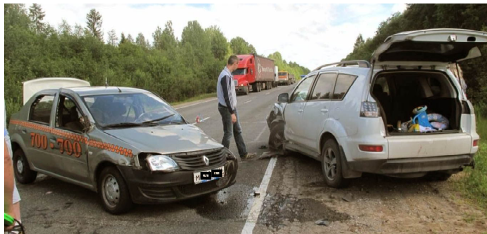
Только соблюдение правил дорожного движения позволит избежать ДТП.