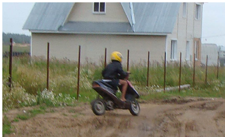
Управлять скутером, мотоциклом и мопедом можно только с 16 лет!

Этой категории участников дорожного движения нужно быть вдвойне осторожными, ездить в шлемах. Ведь, в отличие от автомобилей, скутеристы не защищены кузовом. Неустойчивые скутеры часто