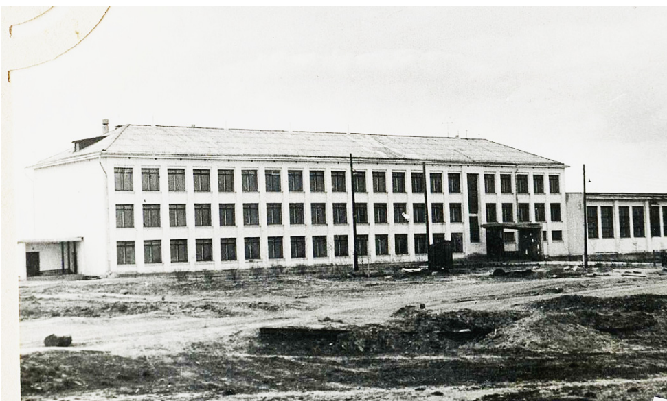
Строящееся здание школы.