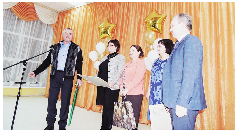
Поздравление от гостей.

Трудовой коллектив главного учебного заведения района - 88 человек, из них 61 - педагоги (это учителя математики, физики и информатики, русского языка и литературы, истории и обществознания, биологии, химии и географии, учителя начальных классов и физической культуры, музыки, изо и технологии, английского, немецкого и французского