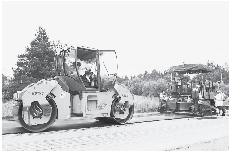
В 2017 году положен асфальт по центральной дороге в д. Ногинская-Волховская.