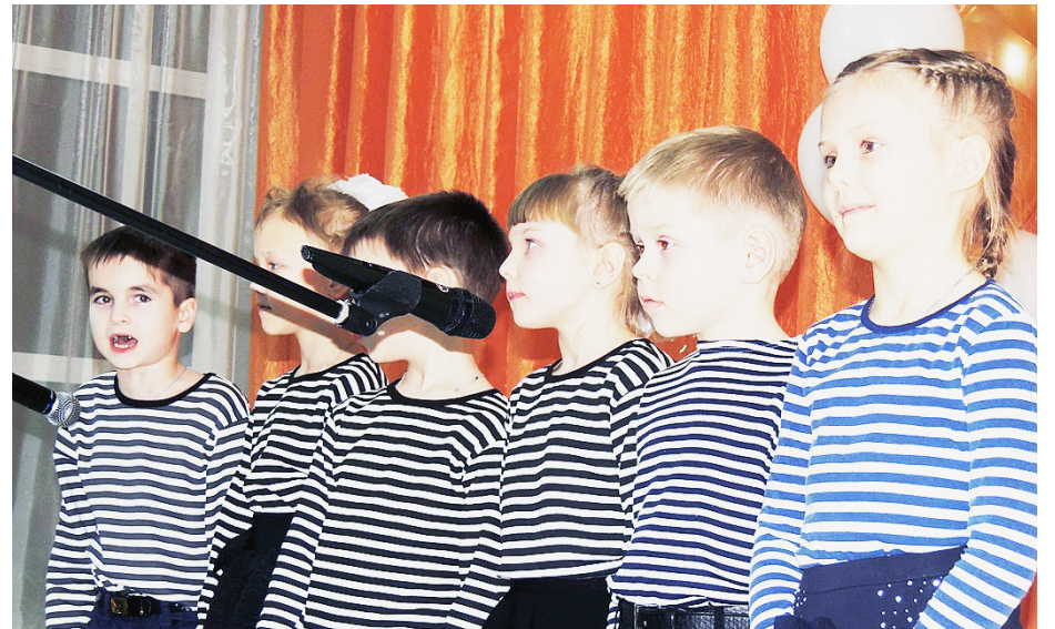
Юные воспитанники Сямженской школы.