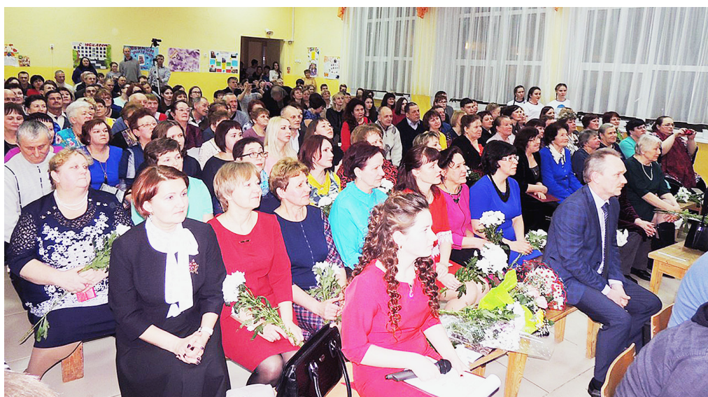
На торжественном мероприятии.

К печати подготовила Ирина МАКАРОВА.