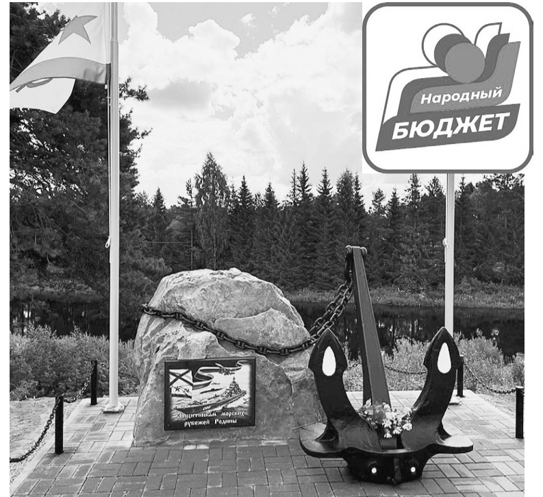
Этим летом благодаря «Народному бюджету» состоялось открытие памятника защитникам морских рубежей нашей Родины.

Всего через месяц с небольшим мы перешагнем порог 2023-го, и постепенно начнем ставить галочки напротив проектов, реализованных уже в новом году. Их концепция практически не изменится, разве что будут охвачены и другие сферы жизнедеятельности. Так, продолжится разбор ветхих строений и благоустройство общественных территорий в поселениях района, а также обустройство детских площадок там, где это еще не сделано; благодаря программе губернатора будут отремонтированы памятные знаки воинам, погибшим в годы Великой Отечественной войны; ремонтные работы вновь коснутся объектов жилищно-коммунального хозяйства; не останется в стороне и спортивная жизнь района. Это лишь часть всех мероприятий, запланированных на будущий