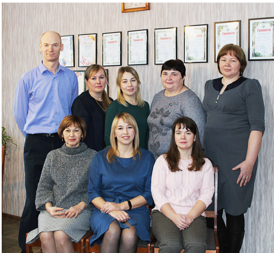
В финансово-экономическом отделе Сямженского лесхоза трудится целая команда сотрудников.

Рабочий день у коллектива начинается в восемь часов, а вот заканчивается не всегда вовремя: иногда, по словам сотрудников, приходится задерживаться — особенно в период работы над отчетами. При этом спектр выполняемых функций у отдела очень широк. Его работники с