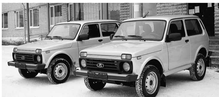
Новые автомобили отправились в Режу и Двиницу.