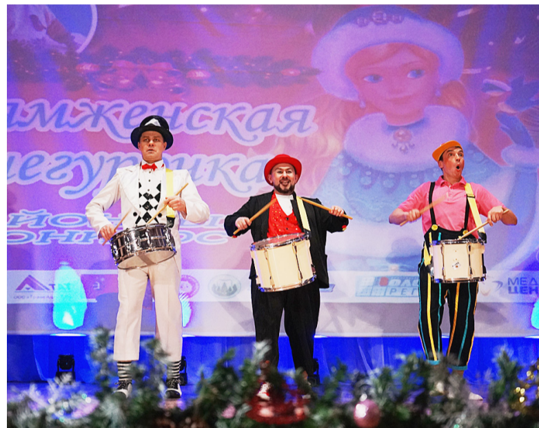
На мероприятии выступили артисты из Череповецкого «Дворца металлургов».