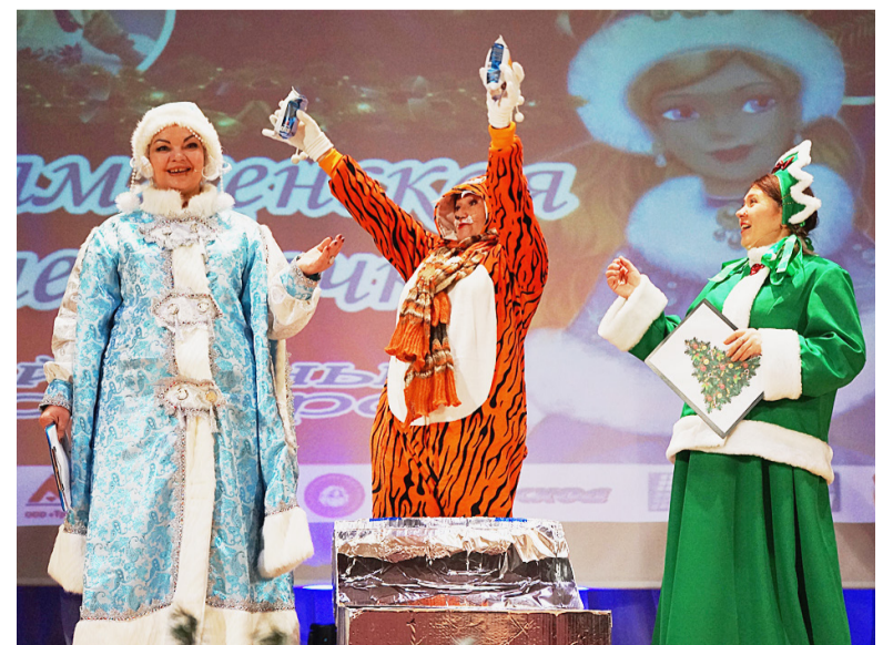
Сладкие подарки для зрителей от Деда Мороза.