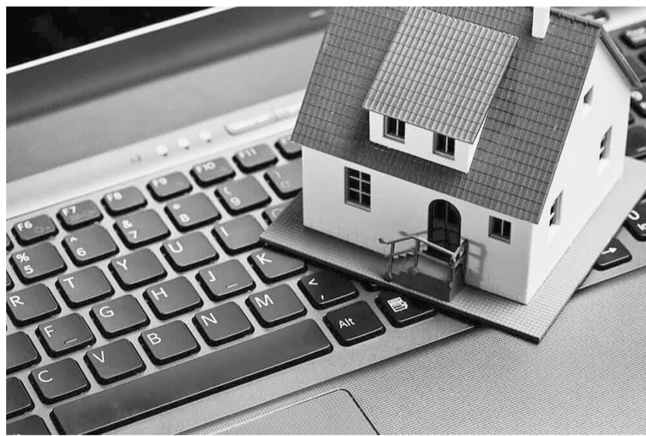
Электронные закладные используют при приобретении вторичного жилья и новостройки, а также жилых домов с земельными участками.

- Потерять электронную закладную практически невозможно. При этом бумажную закладную можно поте-