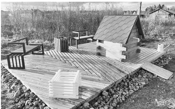
Реализованный в 2022 году проект «Живи, родник» в Раменском поселении.

ВЛАСТЬ И ОБЩЕСТВО Проект реализуется при поддержке Управления информационной политики Правительства Вологодской области.