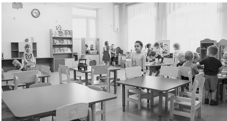
В настоящее время в Сямженском районе двое детей мобилизованных граждан посещают детские сады бесплатно.