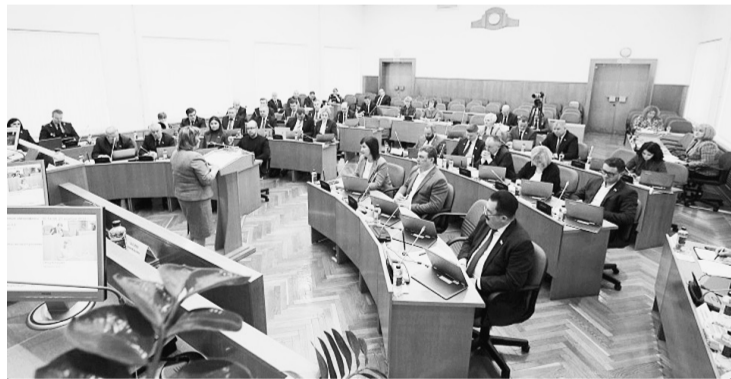
На выделенном участке льготники могут построить дом и улучшить таким образом жилищные условия. Мера распространяется на всех участников боевых действий, в том числе тех, кто защищает наши рубежи и находится в зоне проведения специальной военной операции. Очень важно поддержать наших ребят сейчас.

В стране действует широкий комплекс мер поддержки для тех, кто стоит на защите Родины. Им гарантируют сохранность рабочих мест, обеспечат отсрочку от уплаты налогов и при необходи-