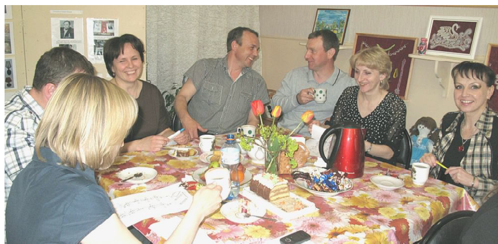
Беседа за чашкой чая.