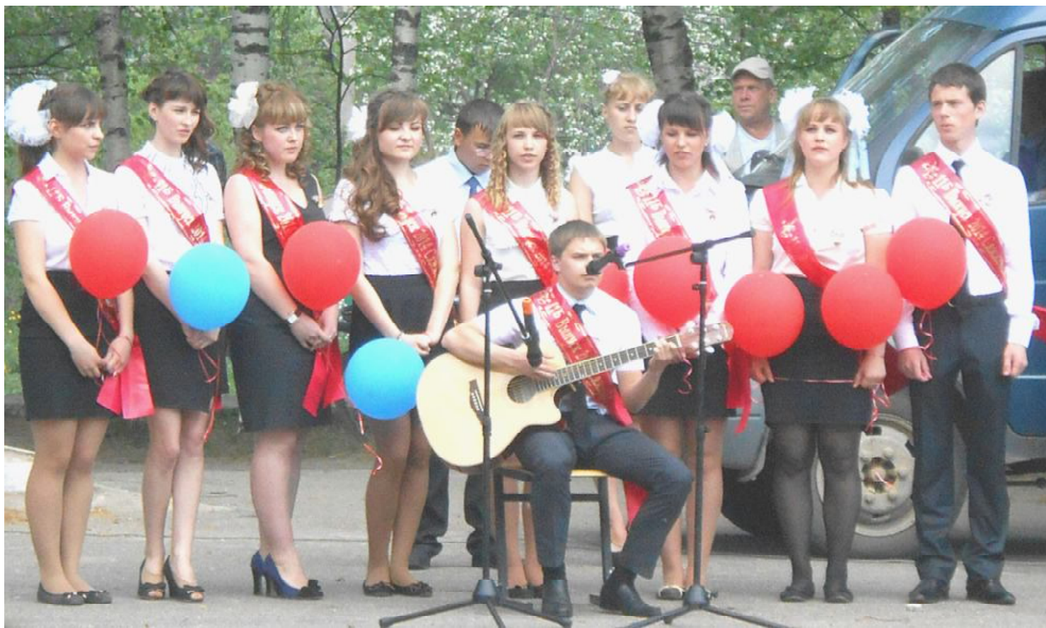
Ответное слово выпускников.

Школа - это "маленькая жизнь", и переход из неё в жизнь взрослую, пожалуй, один из самых значимых этапов для каждого человека.