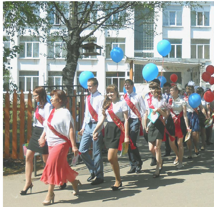
Выходят "виновники торжества".