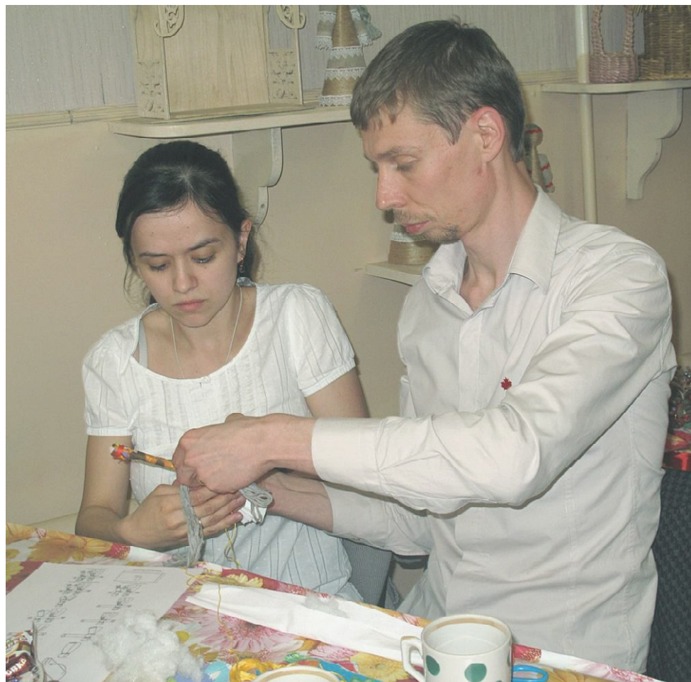
У кукол-неразлучников одна общая рука, чтобы муж и жена были вместе в беде и радости.