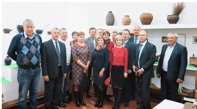
В краеведческом музее.