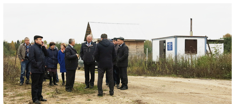
На полигоне ТБО.

Из культурных объектов они посетили Трубаковский ключик, который считается своеобразной визитной карточкой рай-