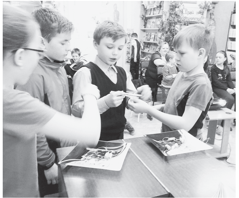
Библиосумерки в детской библиотеке "Япония... познавательные факты для детей".

Среди писателей нынешней Японии наиболее известны Харуки Мураками, Минэко Ивасаки, Кобо Абэ, Такаси Мацуока. Знакомство с своеобразным юмором японцев вызвало немало веселых минут и добрых улыбок. Продолжился вечер рассказом о красоте японской природы - цветении вишни и священной горе. К слову, вишня в Японии - это не то же самое, что в других странах. В Японии растет особый сорт вишни, называемый сакурой. А его цветением восхищаются по всему миру. Это дерево - символ, а цветение сакуры для японцев - национальный символ, такой же, как и священная