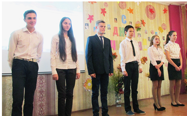
Выступает 9 класс.