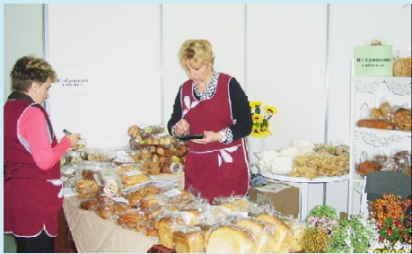
СЯМЖЕНЦЫ НА ОБЛАСТНОЙ ВЫСТАВКЕ - ЯРМАРКЕ - СТР. 1