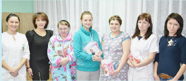
ДЕНЬ МАТЕРИ - ВЕЛИКИЙ ПРАЗДНИК... - СТР. 20.