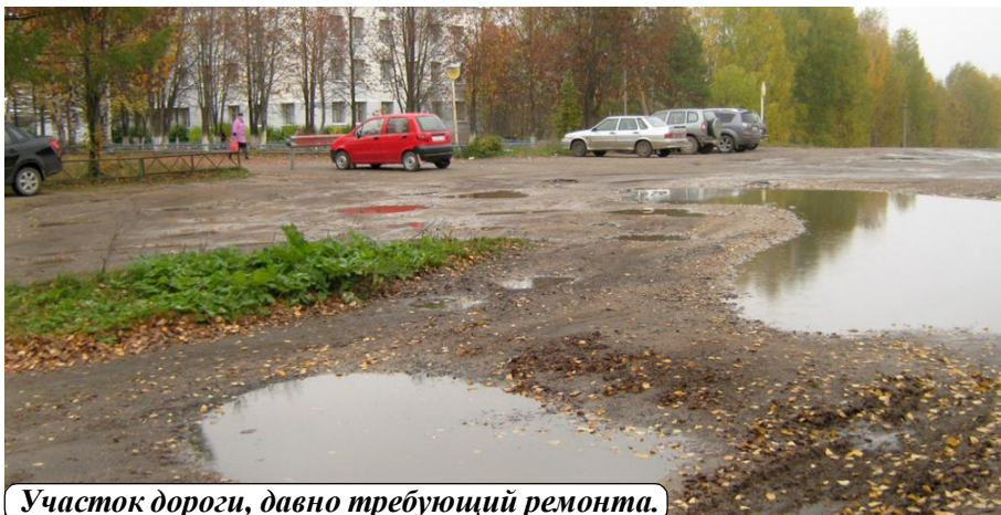
Участок дороги, давно требующий ремонта.