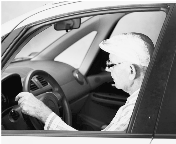
Пенсионеры освобождаются от уплаты налога на легковые автомобили мощностью до 100 лошадиных сил включительно.

Пресс-служба Губернатора Вологодской области.