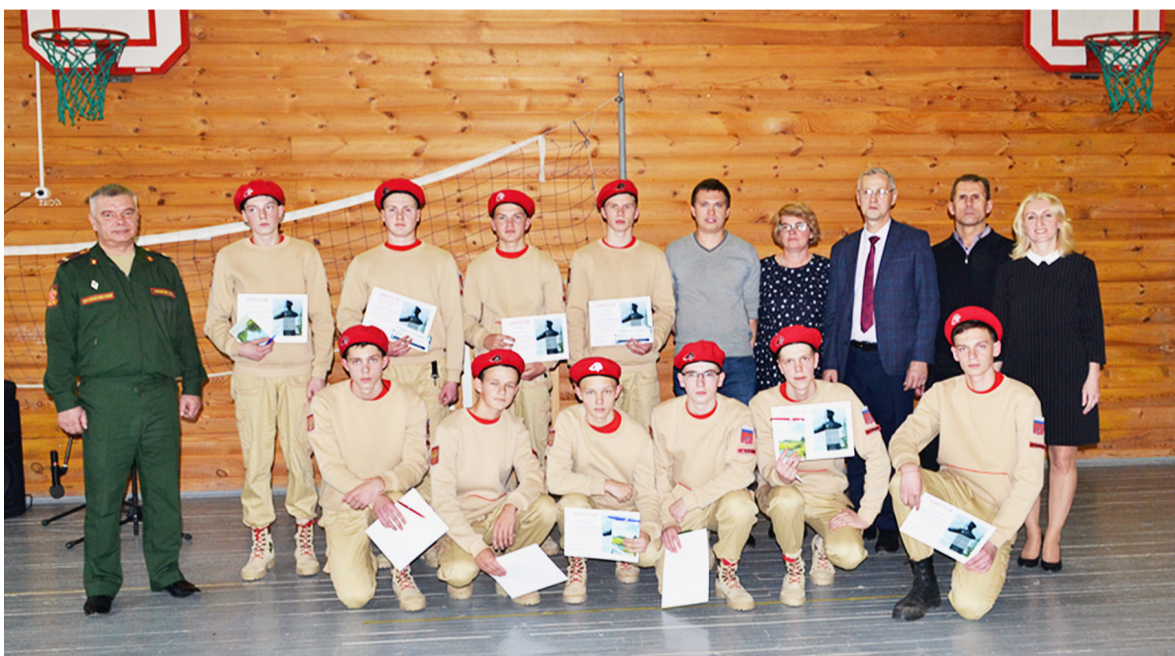
Юноши справились со всеми конкурсными заданиями, показав себя спортивными, ловкими и смелыми.