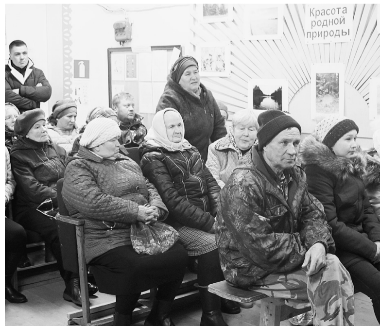
Жители Ногинской хотят, чтобы полигон закрыли.