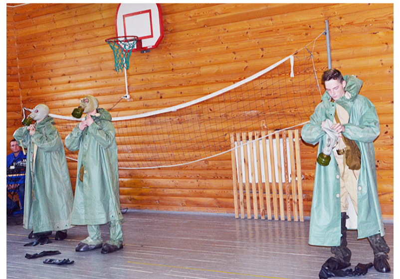
Призывники показали знания средств индивидуальной защиты и умение ими пользоваться.