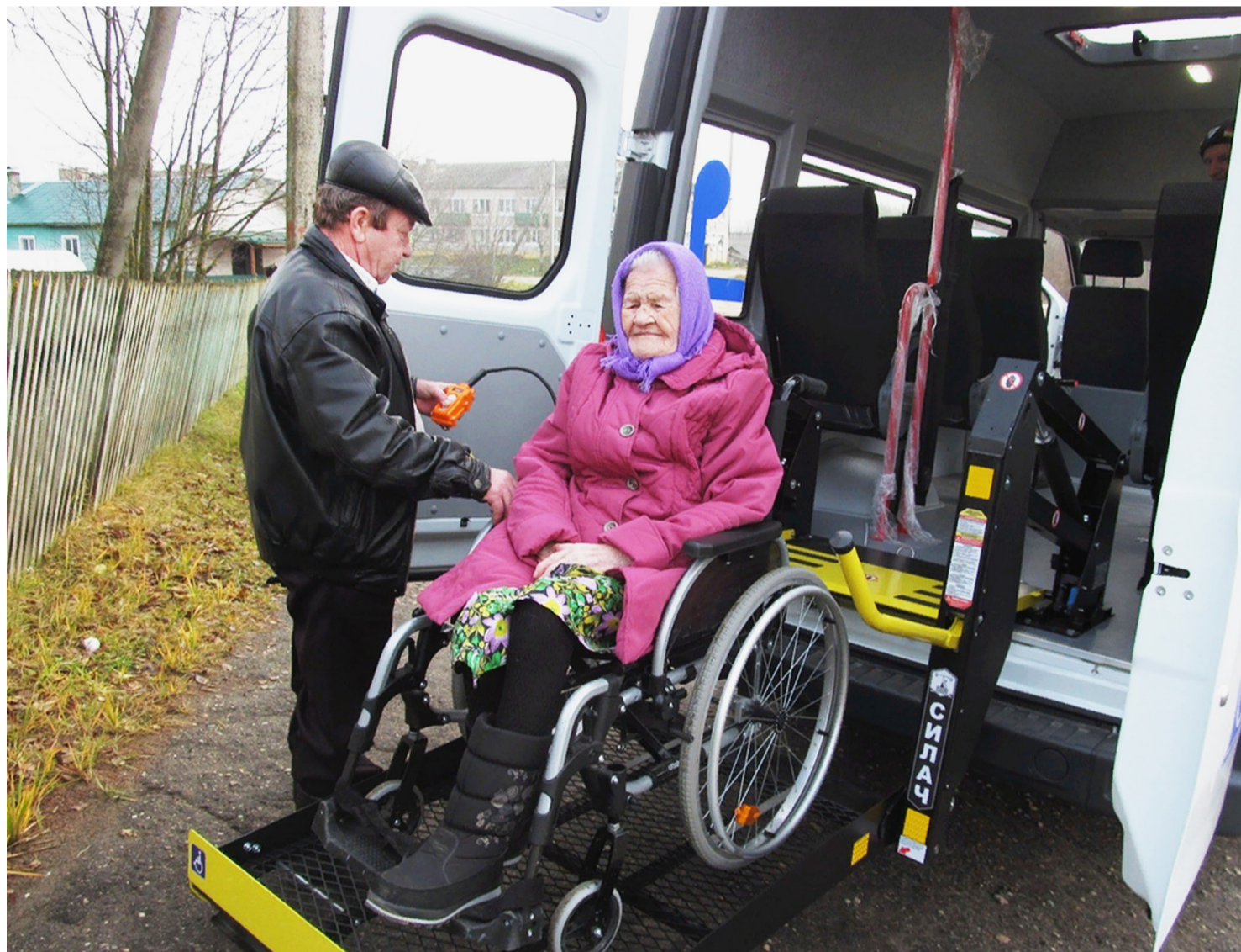
Получатели социальных услуг уже протестировали новое приобретение. Автомобиль оснащен необходимым количеством посадочных мест и электроподъемником для инвалидной коляски.

В рамках регионального проекта «Старшее поколение» национального проекта «Демография» Комплексный центр социального обслуживания населения приобрел новый автомобиль, оборудованный для перевозки людей с ограниченными физическими возможностями. Проект «Демография» стартовал с начала 2019 года, его приоритетной задачей является улучшение качества и продолжительности жизни населения пенсионного и предпенсионного возраста.