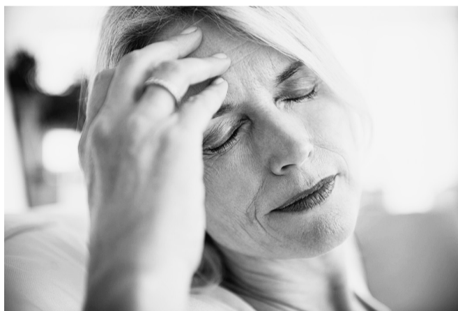
При возникновении подозрений на инсульт необходимо срочно вызвать бригаду скорой медицинской помощи и немедленно госпитализировать пациента.

Снять тесную одежду, расстегнуть воротничок рубашки, тугий ремень или пояс;