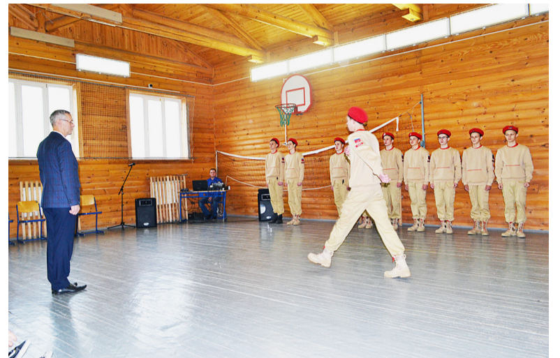
Демонстрация строевой подготовки.

Итак, победителем районного конкурса «Призывник года», посвященного подвигу