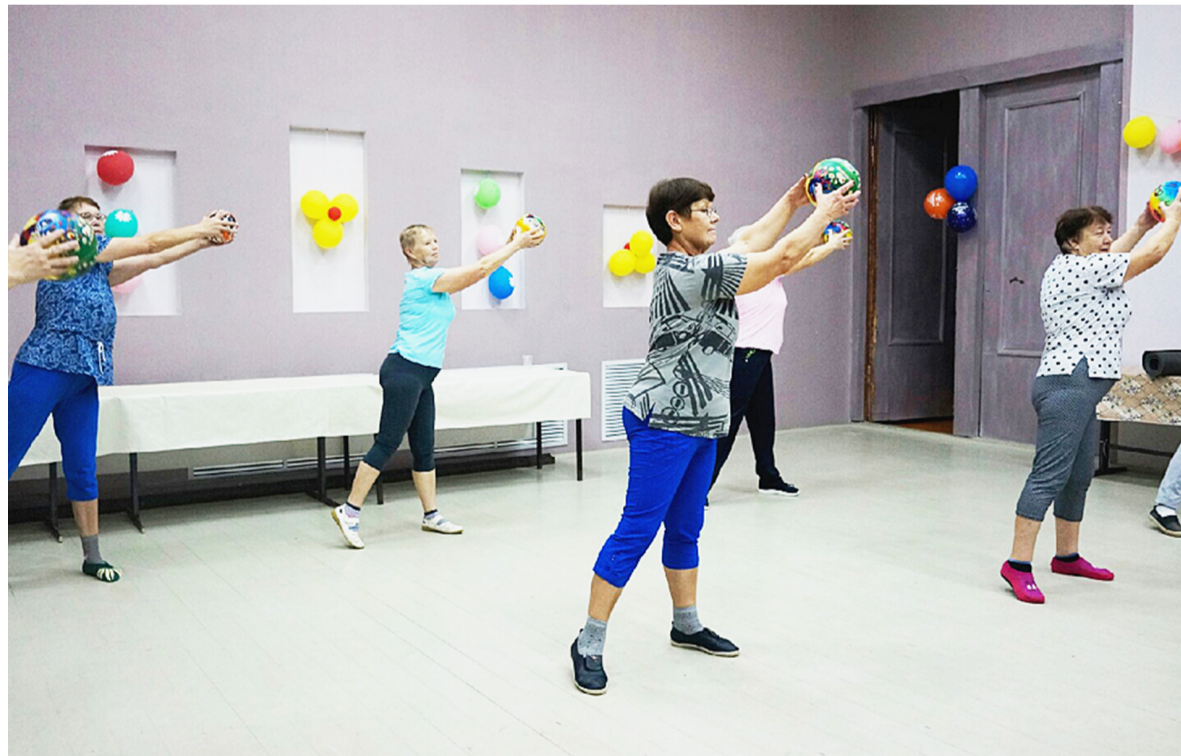
Верится, что имена участниц клуба «ЗОЖ» будут в числе победителей не только районных, но и областных спартакиад среди ветеранов.

Лариса КУЛЕШОВА.