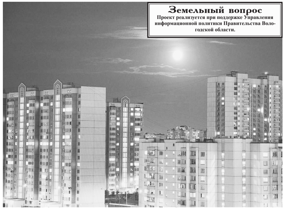
Земельный вопрос Проект реализуется при поддержке Управления информационной политики Правительства Вологодской области.

Особую бдительность следует проявлять в случае, когда продавец действует от лица собственника недвижимости по доверенности, поскольку такую схему часто выбирают мошенники. Можно провести проверку подлинности доверенности на сайте Нотариальной палаты.