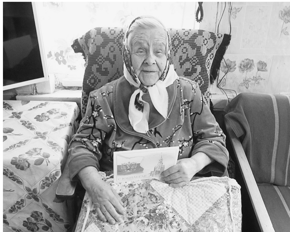
Годы идут, но именинница старается не поддаваться болезням и недугам.

Леонидовны — родные и близкие. Навещают любимую бабушку и прабабушку внуки и правнуки. Вот и в эти выходные родные соберутся, чтобы отметить большой и славный юбилей.